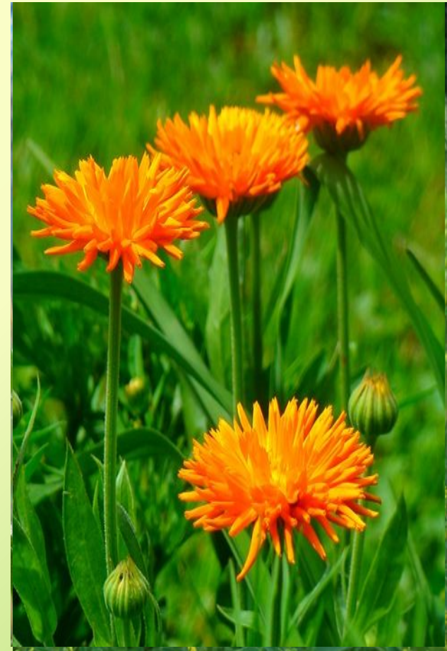
МЪЩИНЫЙ КАЛЕНДУЛИК ГОРОШЕК