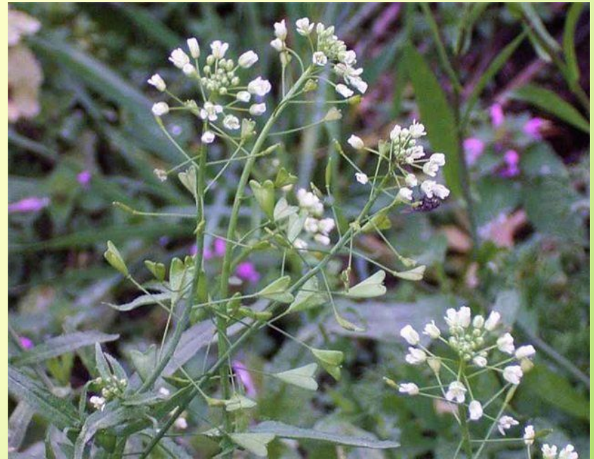
ПАСТУШЬЯ СУМКА ТЫСЯЧЕЛИСТНИК