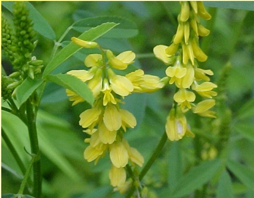
МЫШИНЫЙ ДОННИК ГОРОШЕК