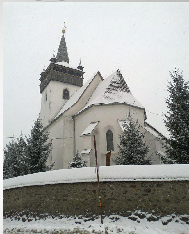
Церква Святої Єлизавети в Хусті на Закарпатті