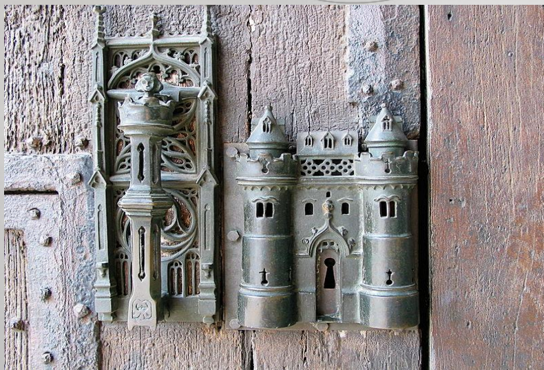
Отвір для ключа та ручка. Місто Монс, Бельгія.