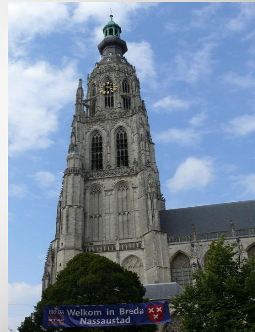
Велика церква, м. Бреда

Вже в 12 столітті архітектура Нідерландів та їх інженерне знання досягли значних успіхів. Нізинні землі (Нідерланди) мають вологі, нетривкі ґрунти. Тут небезпечно було будувати досить високі собори з кам'яними склепіннями, а ті, що будували, руйнувалися через усадку споруд і ґрунту. . Це обумовило спорудження лише величних веж і невисоких сакральних споруд з дерев'яними перекриттями.