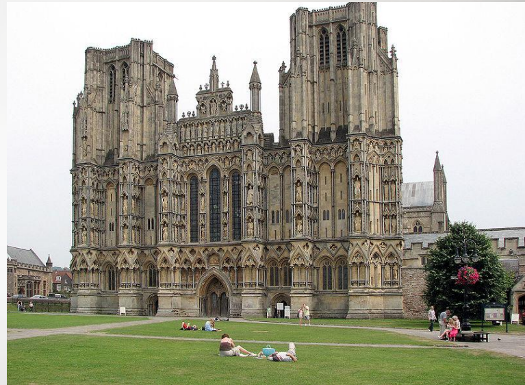
Сомерсет, Кафедральний собор, Британія.

Готика Англії виникла дуже рано (наприкінці XII ст.) й існувала до XVI ст. Млявий розвиток міст призвів до того, що готичний собор став не міським, а монастирським, оточеним полями і луками. Готичні пам'ятки є в Бельгії, Чехії, Австрії, Польщі та інших країнах Європи.