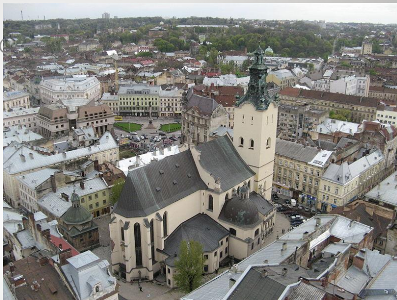
Львівський катедральний костел