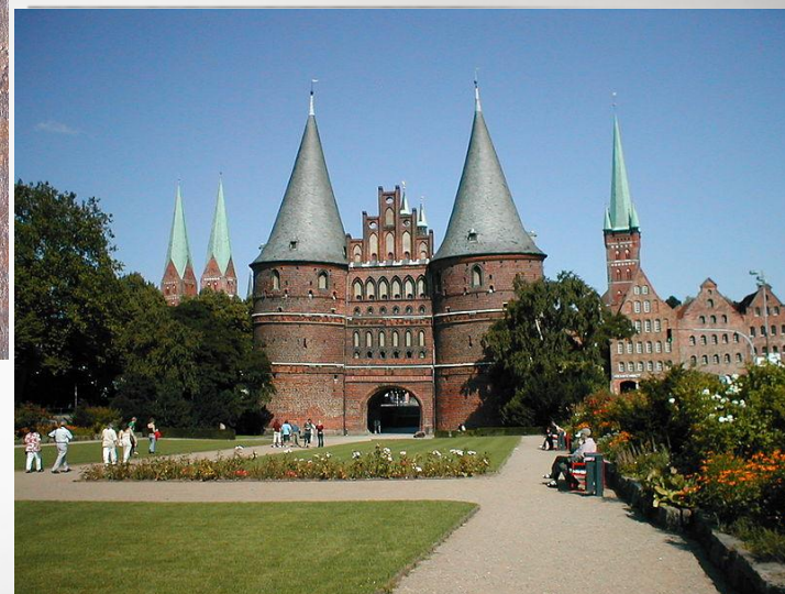
Любек, Німеччина, готичні Голштинські ворота.