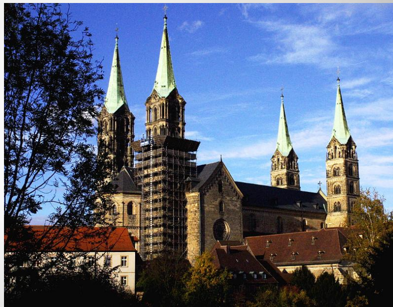
Собор Санкт-Петер-унд-Георг, Бамберг, Баварія

Поступово німецька готика набуває міцці, індивідуальності і з'являються як запозичені з Франції зразки, так і оригінальні, місцеві. Архітектори не розробляють і не прикрашають західний фасад, як у Франції, веж часто не дві, а одна висока або чотири.