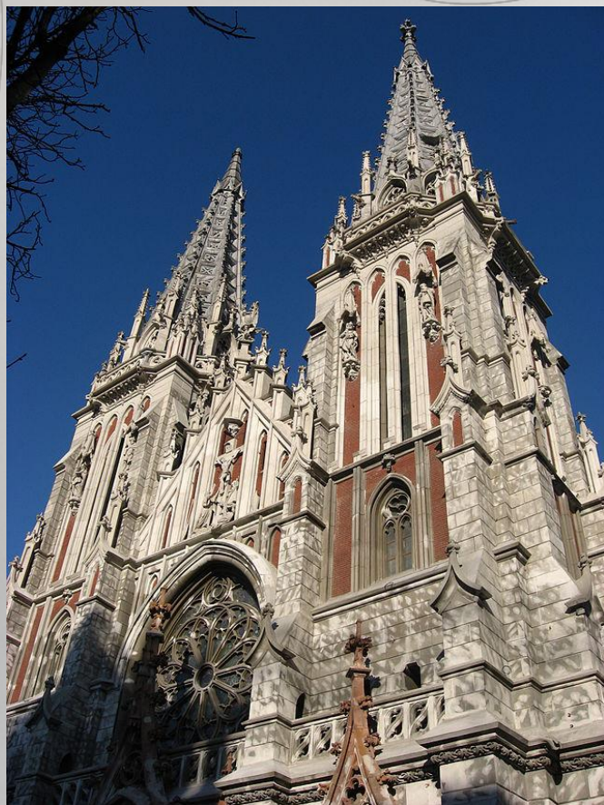
Церква Святого Миколая. Місто Київ, Україна.