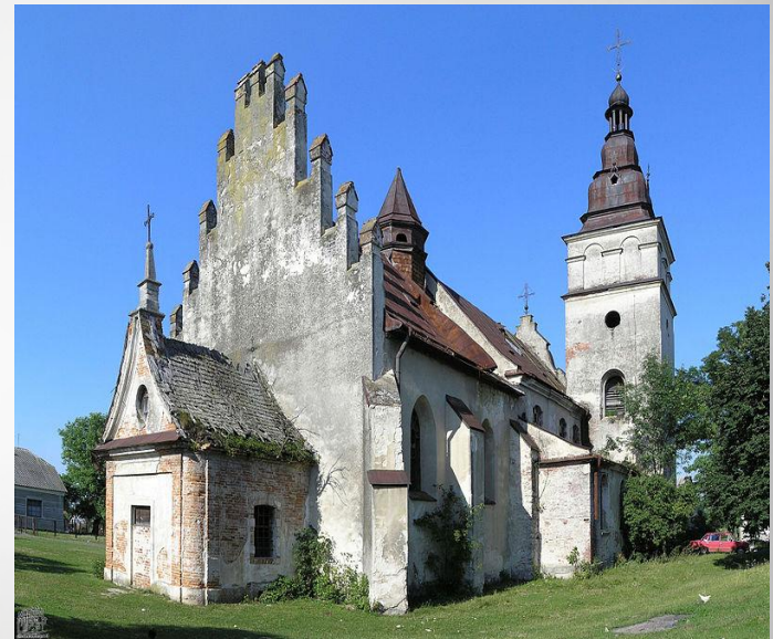
Миколаївський костел у Вишнях (1400—1651)

На західних землях, які менше за інші потерпіли від монголо-татарської навали, тоді зростають міста, розвиваються ремесла й торгівля. В українські міста прибуває багато поселенців, переважно німців, які принесли в мистецтво, а зокрема в архітектуру, нові стильові форми.