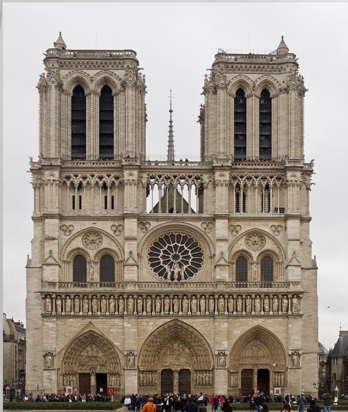
Собор Паризької Богоматері