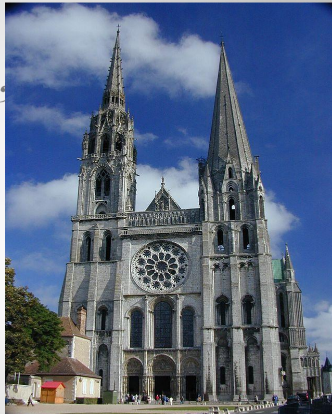
Собор в Шартрі, Франція