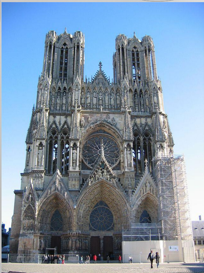
Реймський собор, Франція