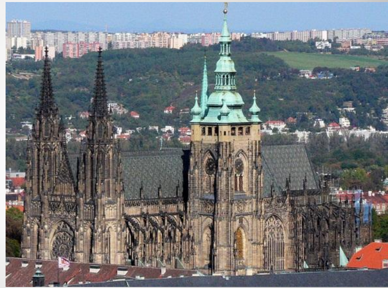
Собор святого Віта, Прага.

В добу готики (13-14- частково 15 століття) Чехія увійшла в коло розвинених і культурних країн Європи, що мала значну самостійність. Архітектори швидко засвоюють нові архітектурні ідеї. Малостійка дерев'яна архітектура замінюється кам'яною, що сприяє її безпеці та збереженню на століття.