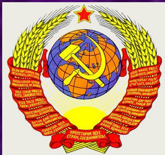
Флаг и герб СССР

По мере его развития федералистские принципы организации, заложенные в основу Союза, постепенно заменялись прежними, унитарными.