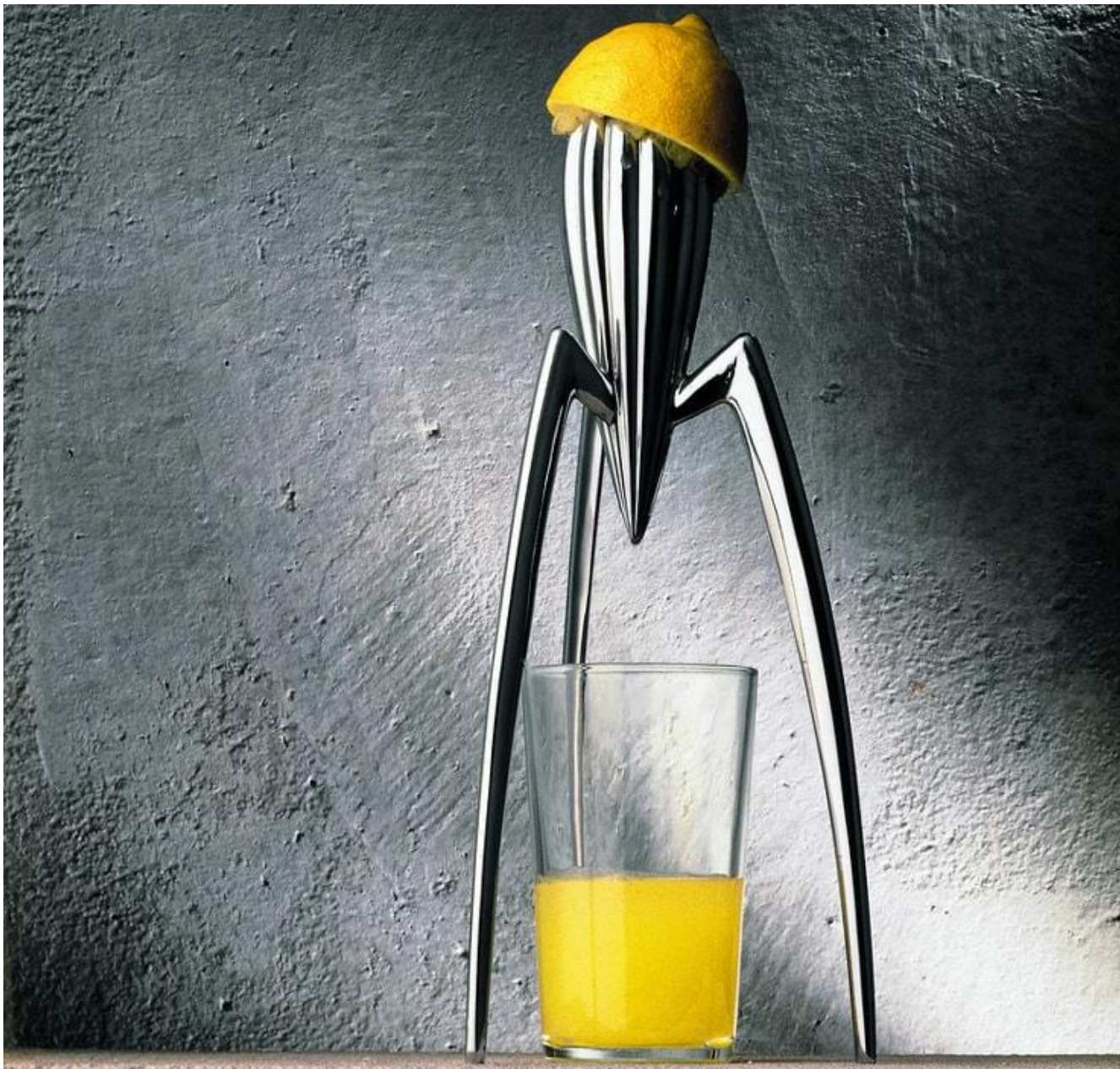
Филипп Старк, соковыжималка «Juicy Salif»