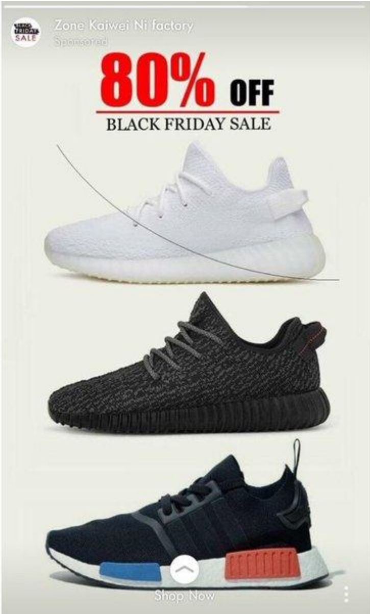
Zone Kaiwei Ni factory