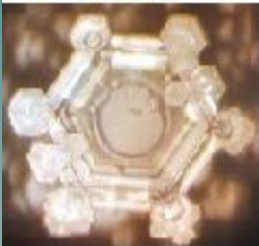
БАХ "Вариации Голдберга"