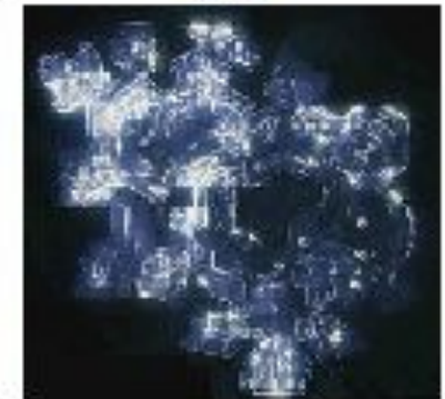
БАХ "Ария на струне соль"