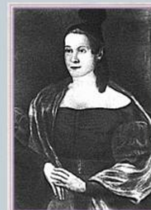
Е.Е.Керн. Неизвестный художник