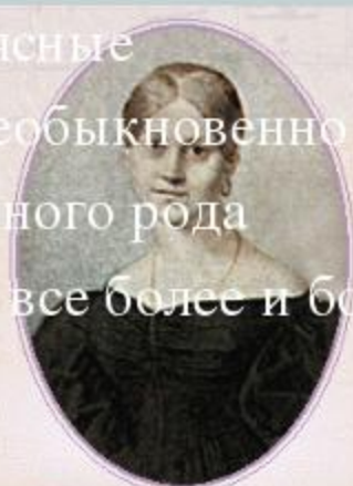
А.П.Керн. Портрет работы неизвестного художника