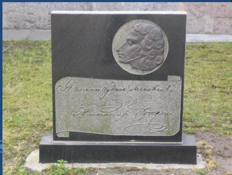
А.С.Пушкин «Зимнее утро»

На стихи Пушкина написано много романсов, вальсы, песни, которые мы называем сейчас - шедеврами русской музыки!