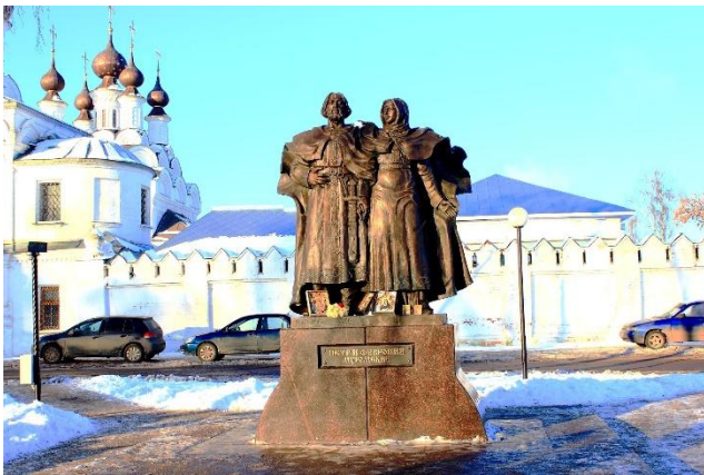
Памятник Петру и Февронии