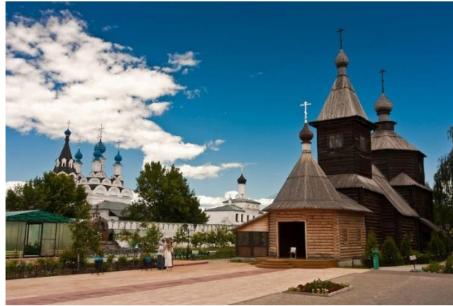
Церковь Сергия Родонежского