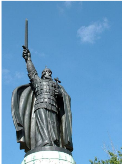
Памятник Илье Муромцу