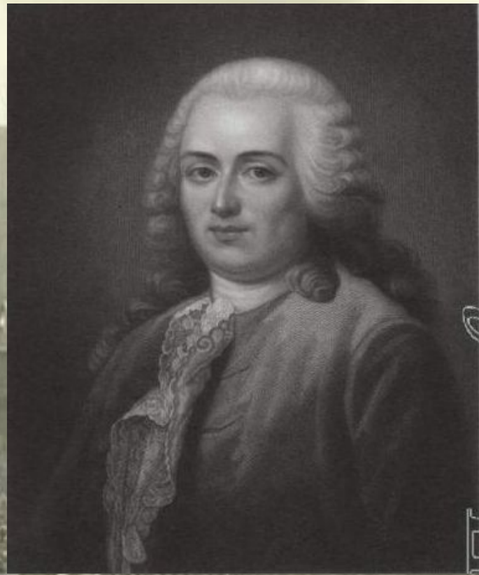
Жак Тюрго 1727-1781

«Размышления о создании и распределении богатства»