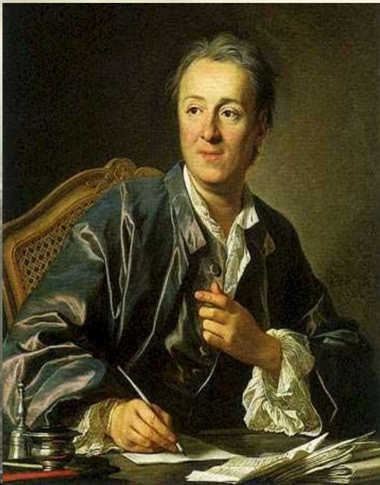
Дени Дидро 1713-1784