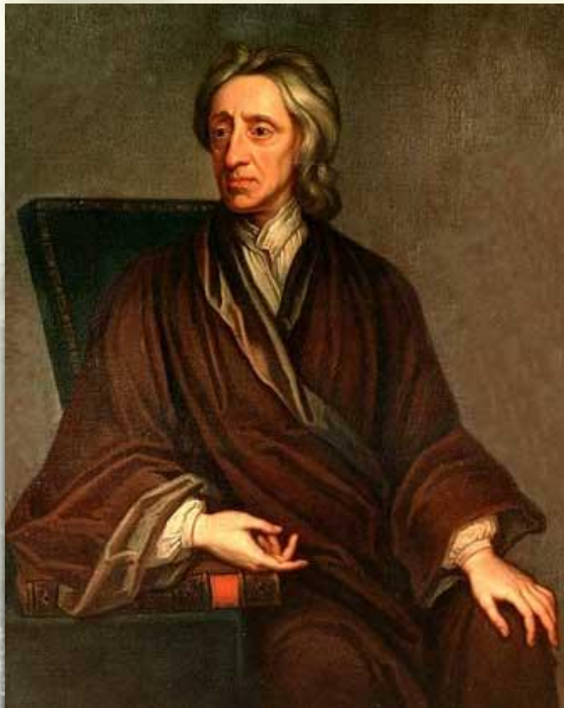
Джон Локк 1632-1704