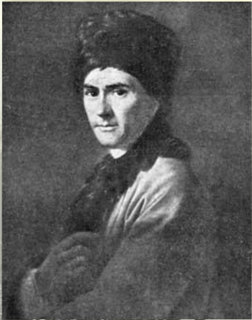
Жан Жак Руссо 1712-1778