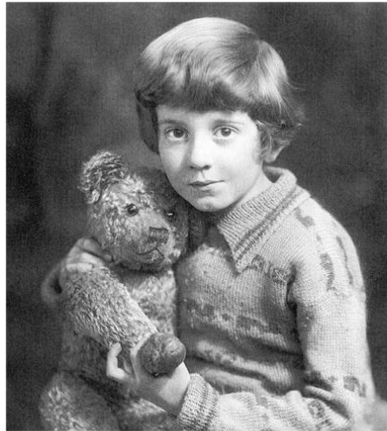
Кристофер Робин Милн