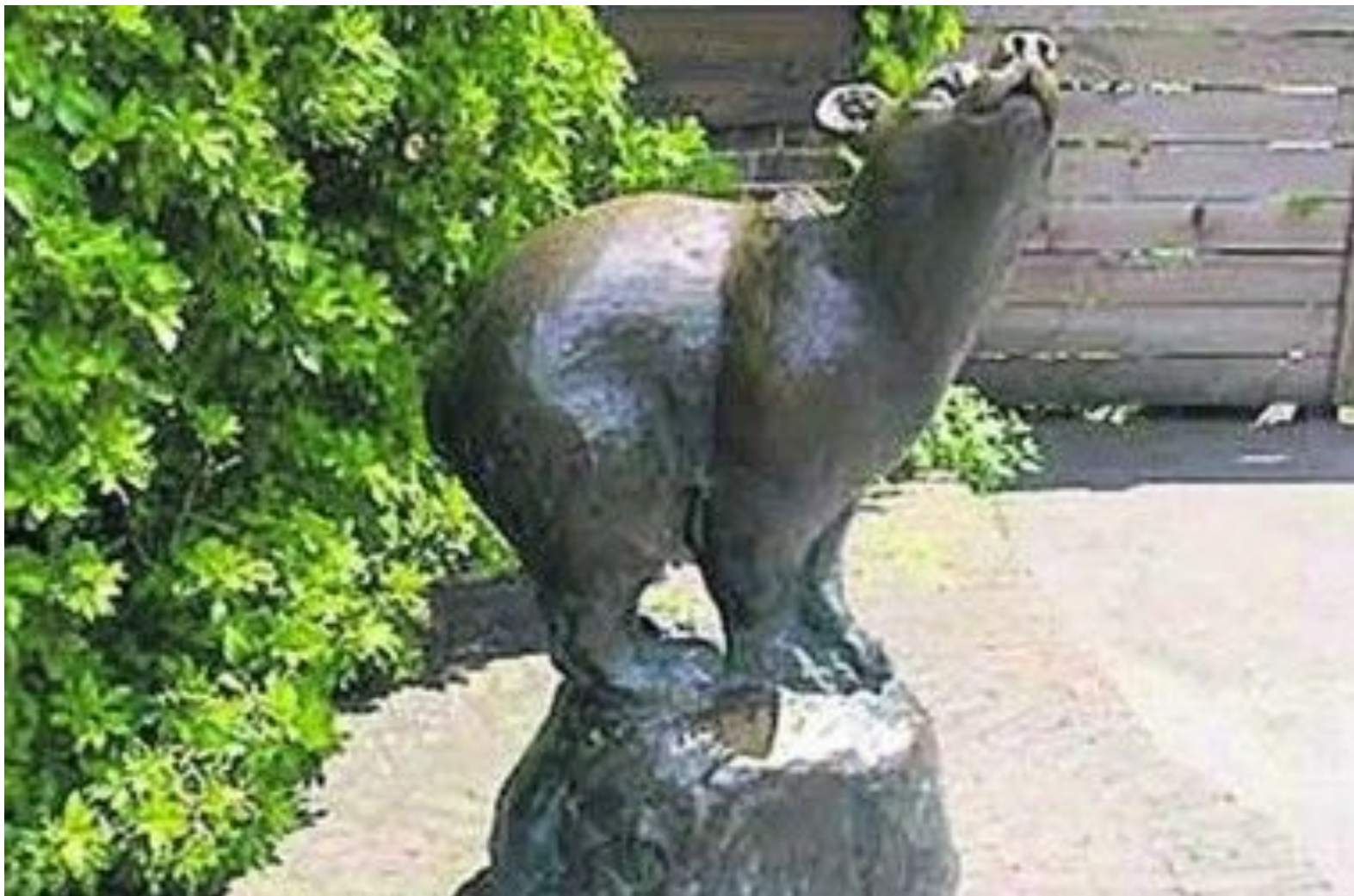
Памятник медведице Винни в Лондонском зоопарке...