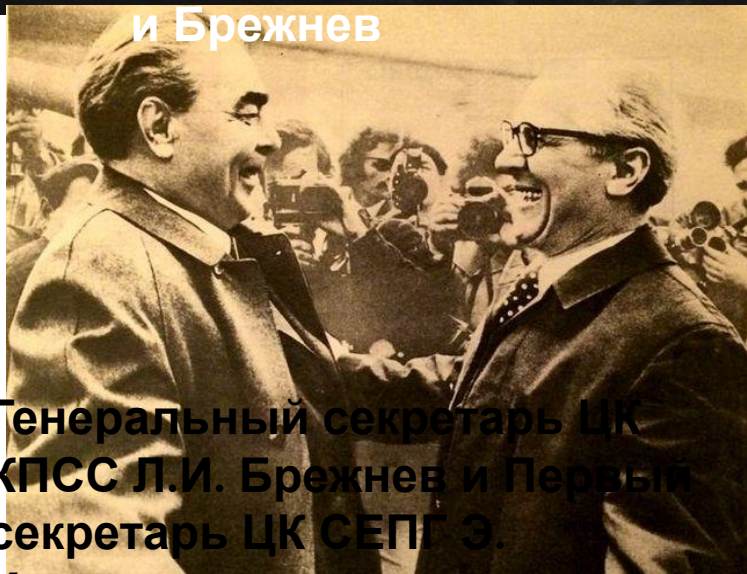
Генеральный секретарь ЦК КПСС Л.И. Брежнев и Первый секретарь ЦК СЕПГ Э.