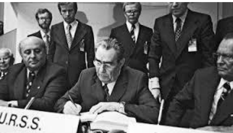
Брежнев подписывает Заключительный акт Совещания

Учреждение на постоянной основе Организации по безопасности и сотрудничеству в Европе (ОБСЕ)