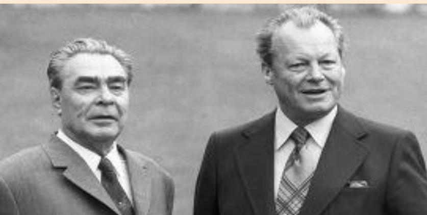
Встреча Брежнева Л.И. и канцлера ФРГ Вилли Брандта