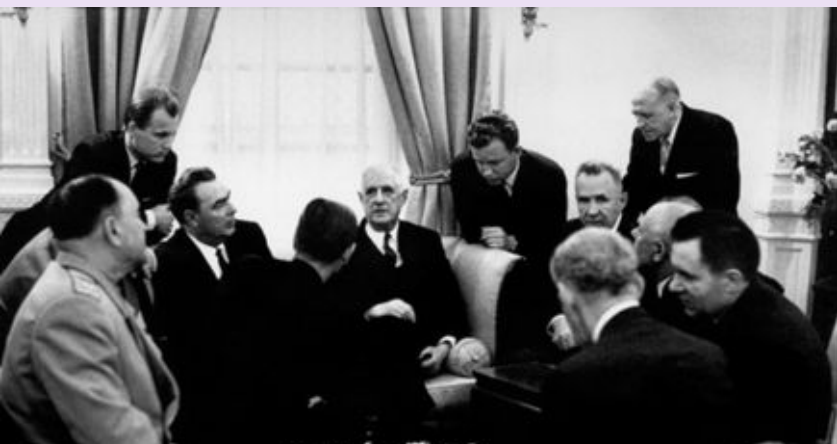
Визит Президента Франции Шарля де Голля в СССР