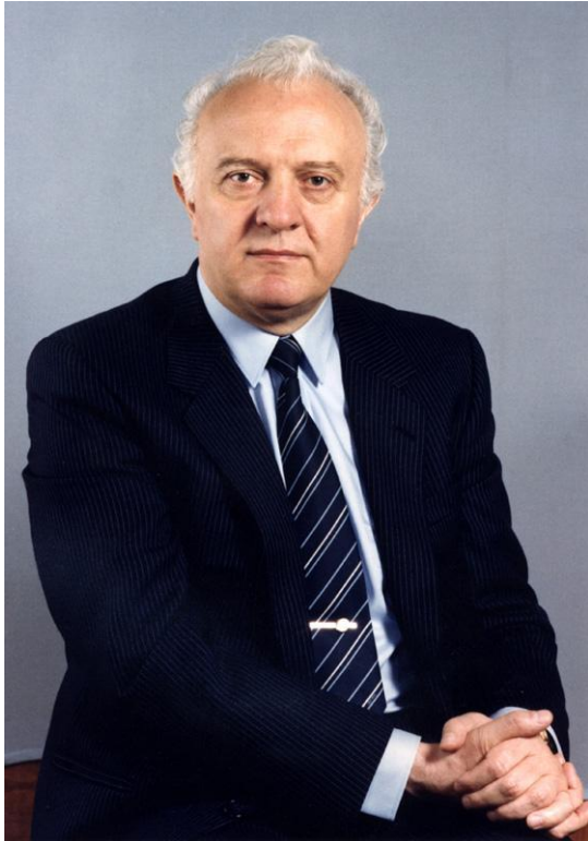
ШЕВАРДНАДЗЕ Э. А. (июль 1985 – январь 1991)