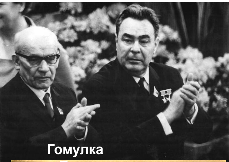
Гомулка и Брежнев