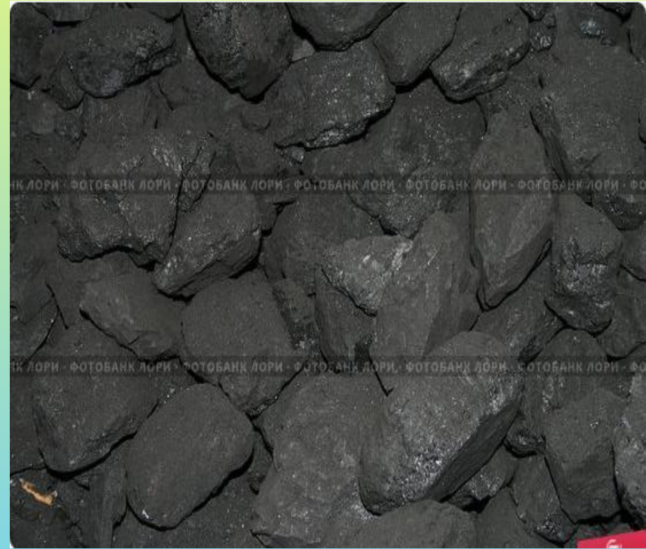
Органического происхождения (каменный уголь)