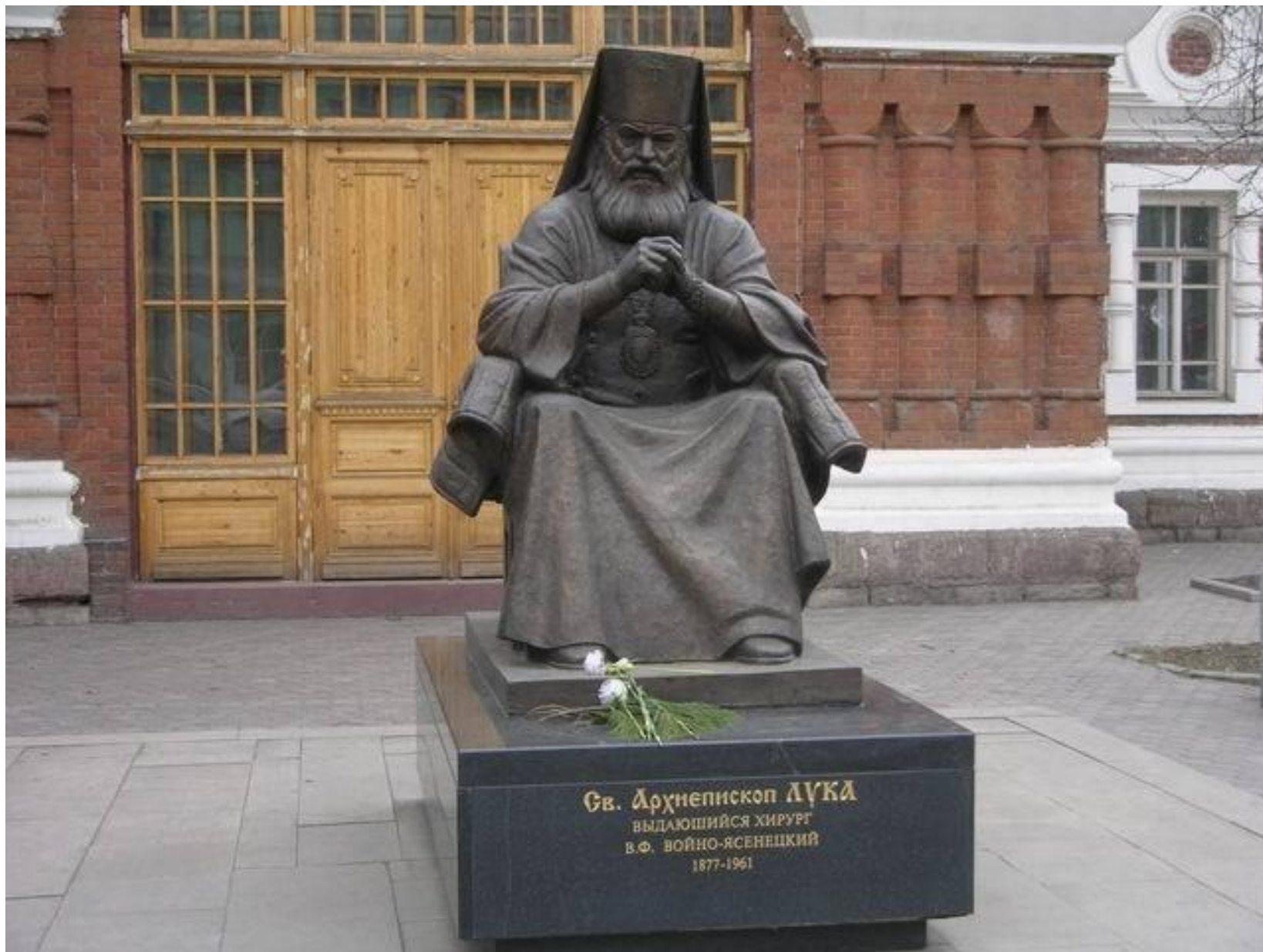
В Красноярске у Архиерейского дома установлен памятник архиепископу Луке (Войно-Ясенецкому)