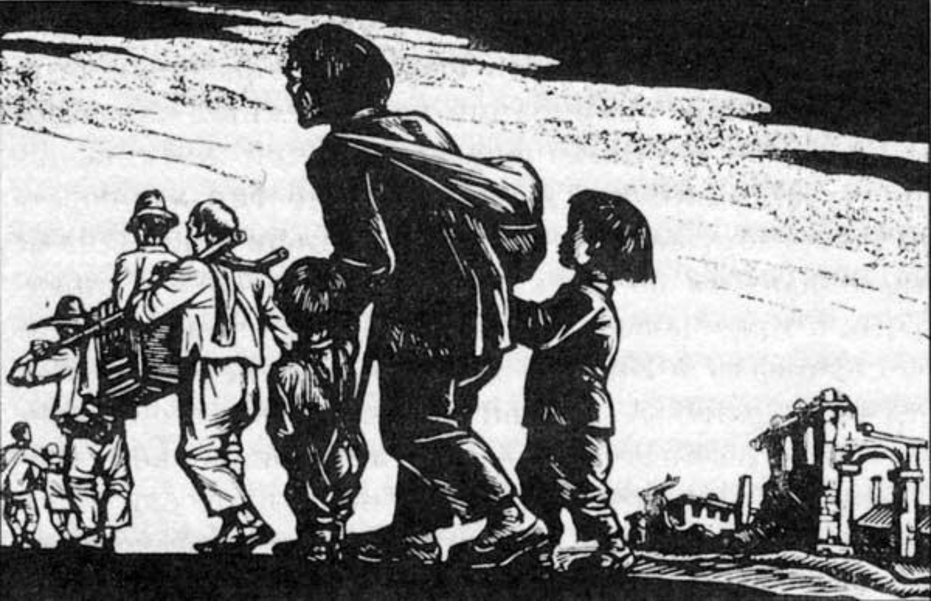
Беженцы в Китае. Художник Ли Хуа