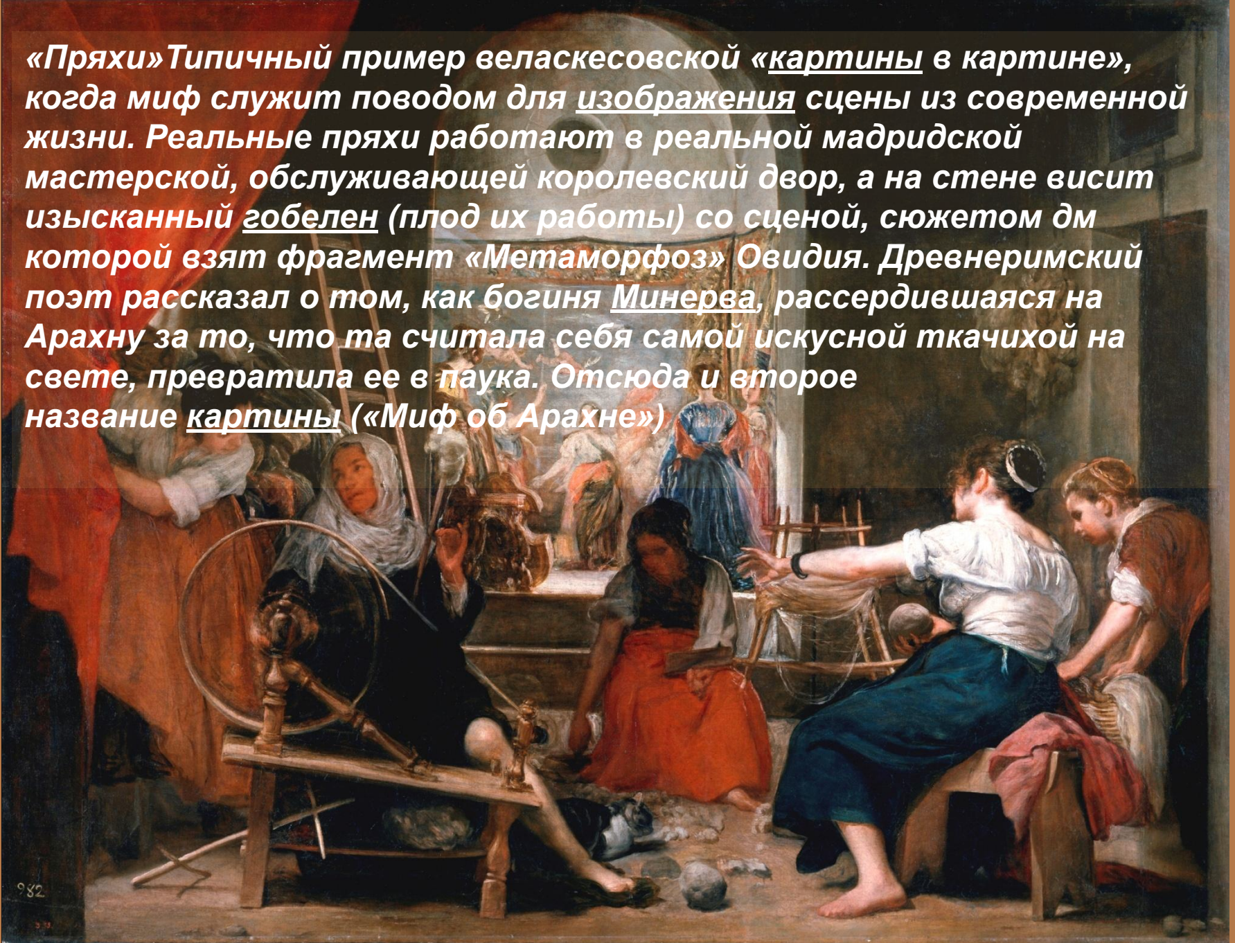
«Пряхи»(др.название «Миф об Арахне»)

«Пряхи» Типичный пример веласкесовской «картины в картине» , когда миф служит поводом для изображения сцены из современной жизни. Реальные пряхи работают в реальной мадридской мастерской, обслуживающей королевский двор, а на стене висит изысканный гобелен (плод их работы) со сценой, сюжетом для которой взят фрагмент «Метаморфоз» Овидия. Древнеримский поэт рассказал о том, как богиня Минерва , рассердившаяся на Арахну за то, что та считала себя самой искусной ткачихой на свете, превратила ее в паука. Отсюда и второе название картины («Миф об Арахне»)