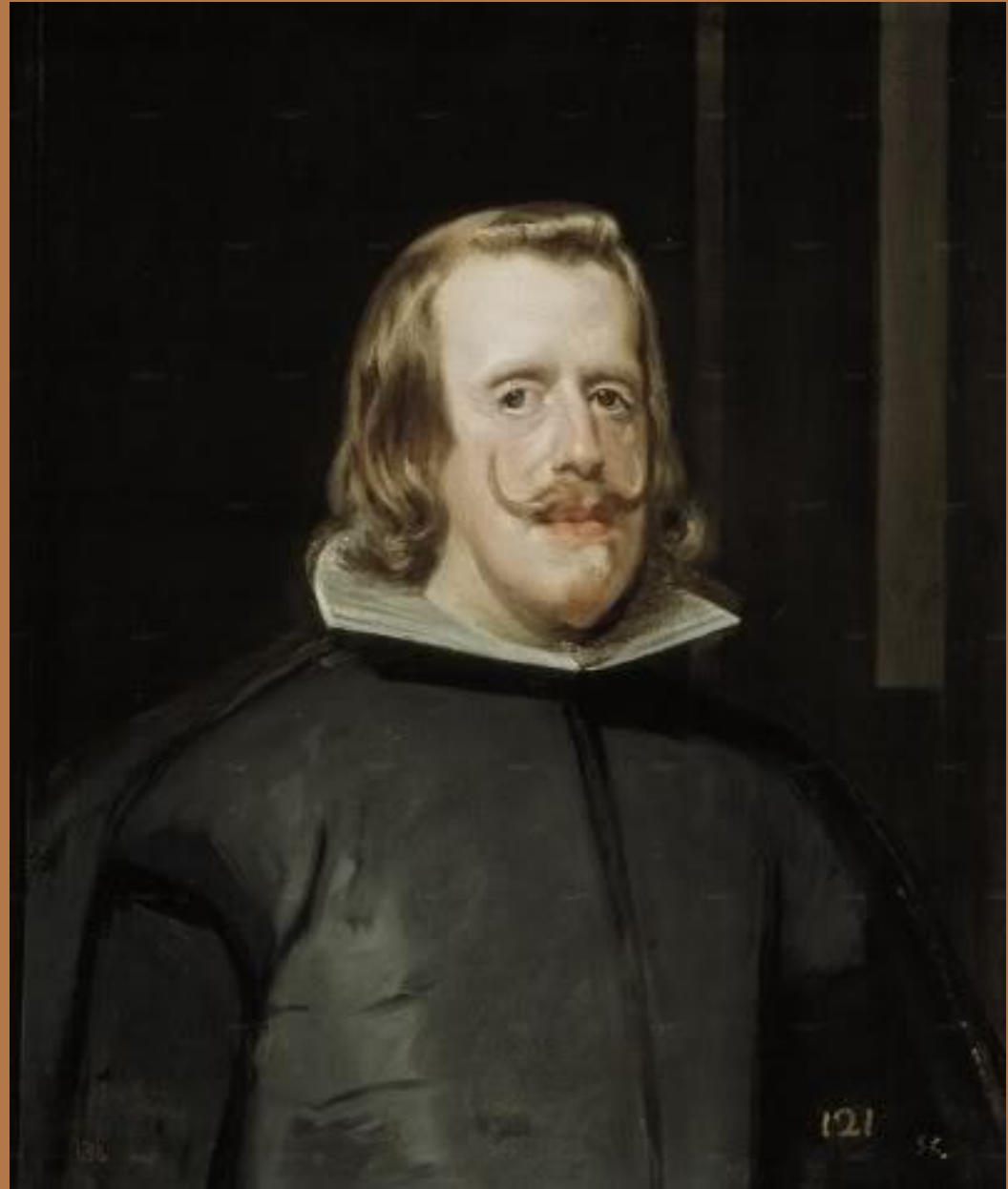
«Портрет Филиппа IV»

Художник пишет портрет молодого короля Филиппа IV, имевший большой успех, и вскоре получает звание придворного живописца.