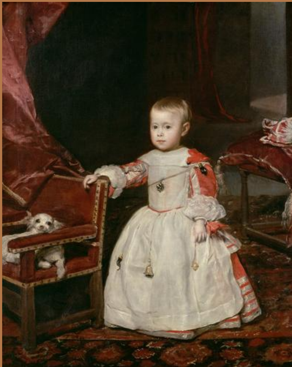
"Инфант Филипп Просперо"