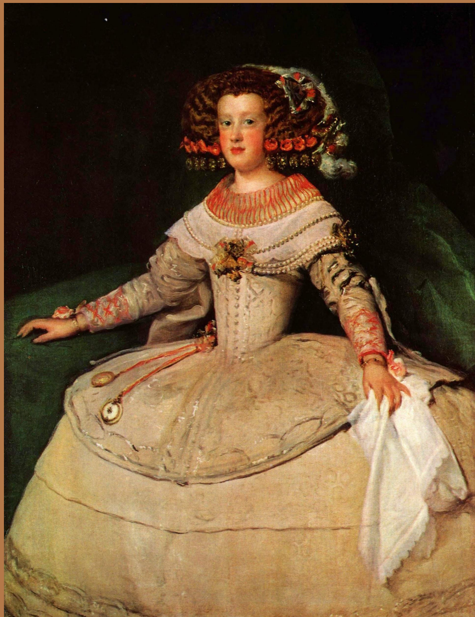
портрет инфанты маргариты Австрийской"