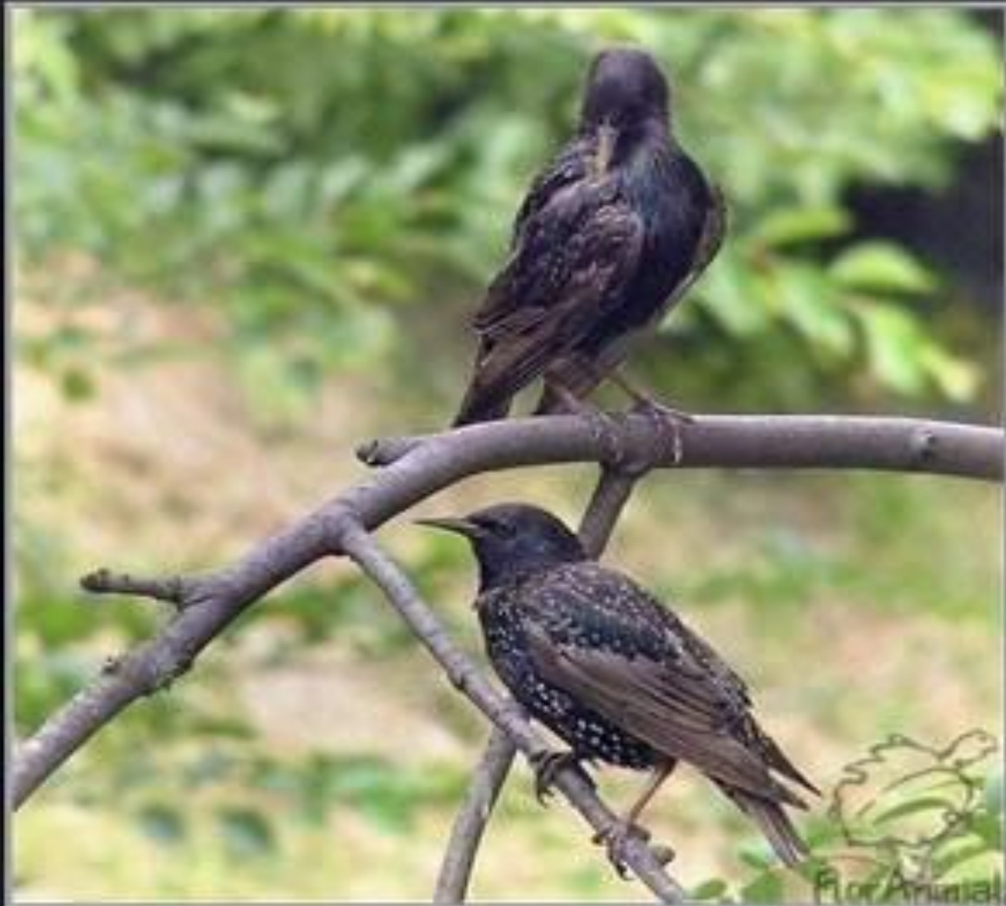
Carpodacus flammeus ( Sturnus vulgaris )