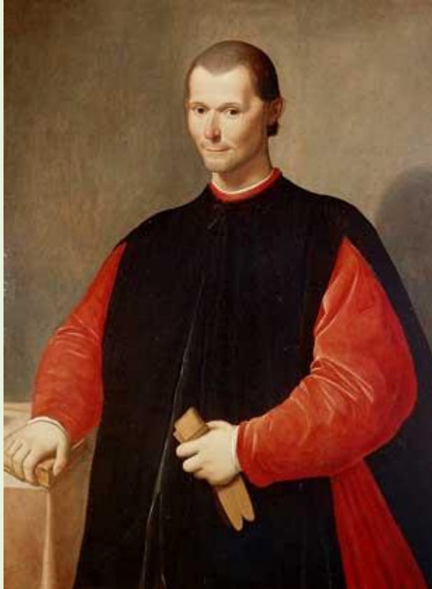
Итальянский теоретик политики