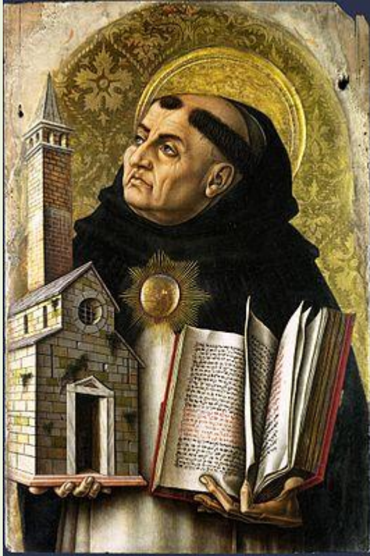
Философ и теолог, доминиканский монах