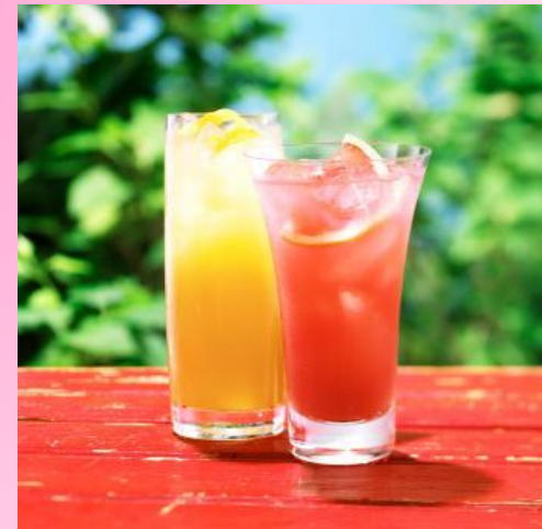
Two glasses of juice