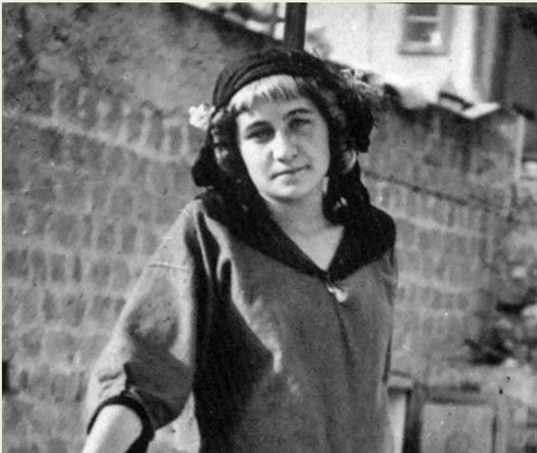
Мария Воробьева-Стебельская (Маревна), вторая возлюбленная Диего