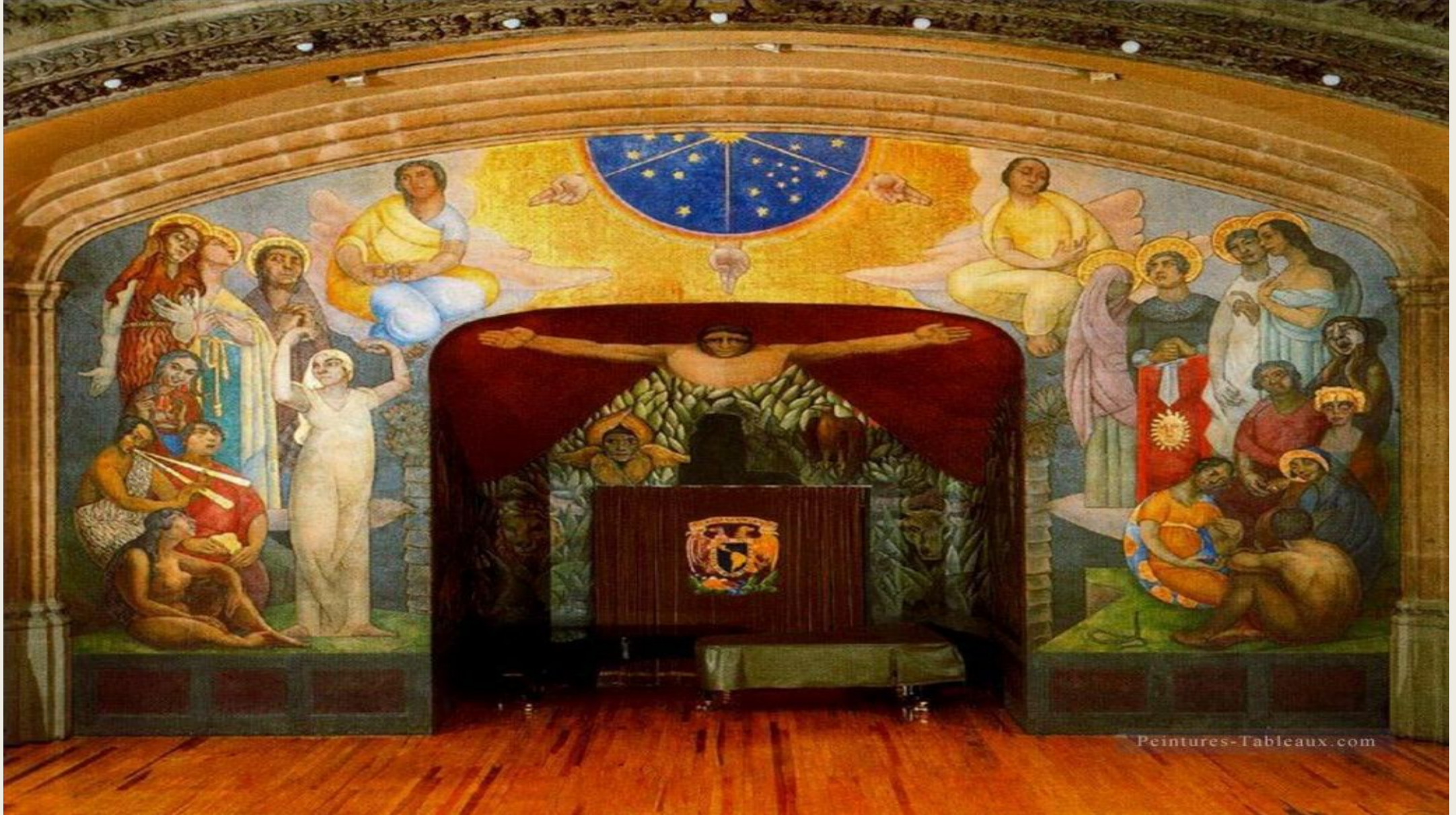
Первая грандиозная фреска «Сотворение» в аудитории Национальной подготовительной школы в Мехико