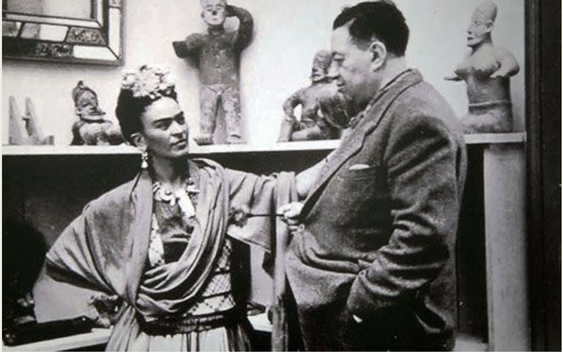
К 1929 году 43-летний Диего повстречал главную женщину своей жизни – 22-летнюю мексиканскую художницу Фриду Кало