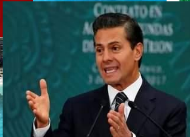
Энрике Пенья Ньето (президент)