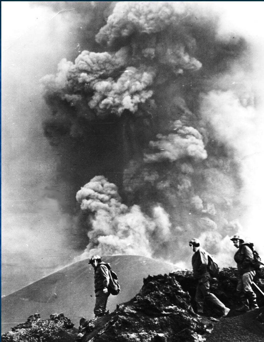
Рис.2. Стромболианский тип извержения на Северном прорыве БТТИ (первый шлаковый конус июнь 1975 г.)