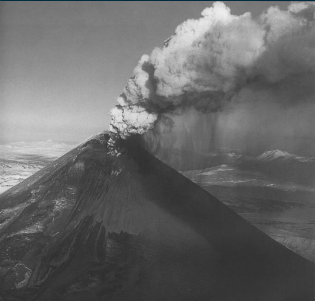
Рис. 3. Разрушенная вулканическая постройка вулкана Безымянного в ходе катмайского извержения 1956 г.