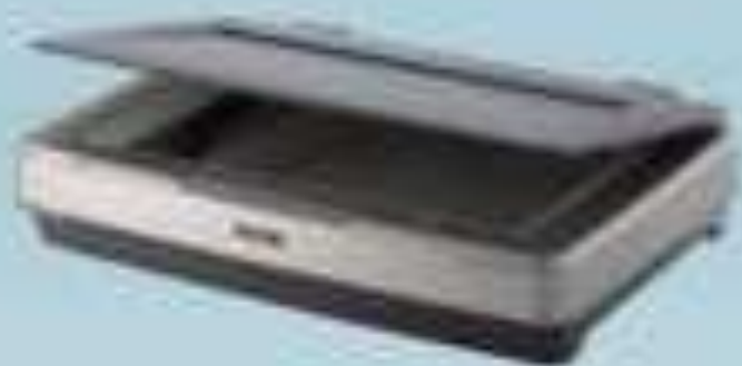
Настольный (планшетный) сканер