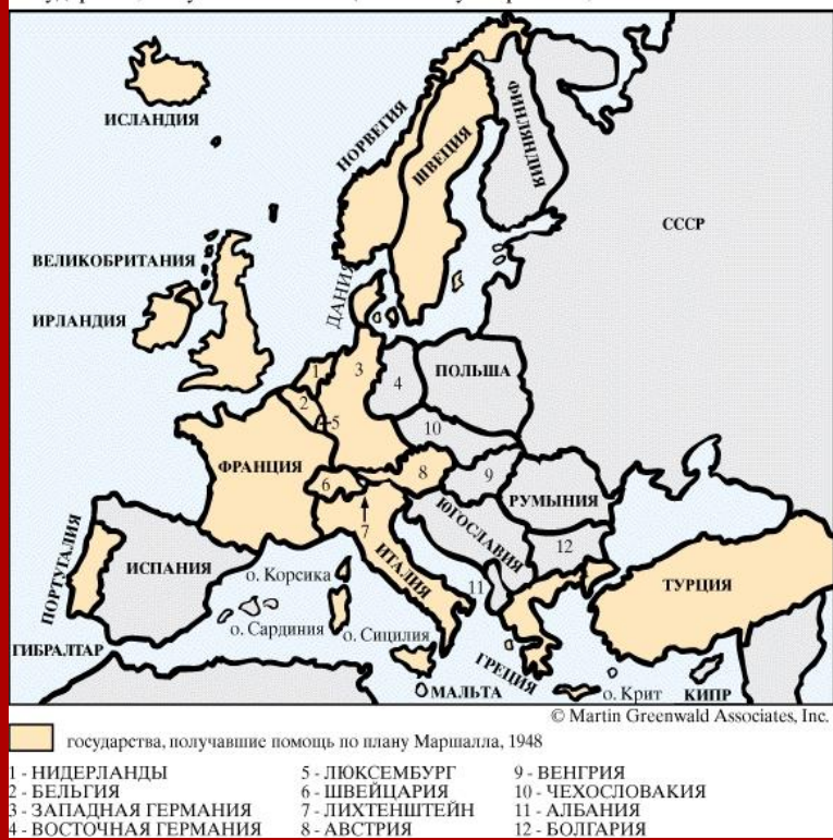
Государства, получавшие помощь по плану Маршалла, 1948

В итоге США получили возможность влиять на политику стран Западной Европы. Их влияние особенно усилилось после оформления в 1949 г. военно-политического блока — Организации Североатлантического договора (НАТО).