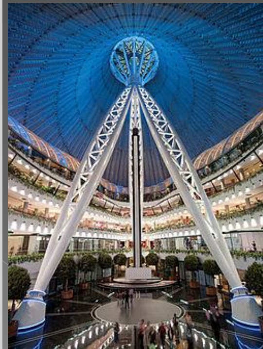
Астанадағы Хан Шатырдың ішкі көрінісі

Постмодернизм түптеп келгенде модернизмге қарсылықтан туындаған. Ол Екінші дүниежүзілік соғыстан кейінгі Батыс Еуропалық ұлы қиялдың быт-шыт болуы себепті өз бойында тұрақтылық, заңдылық, ереже атаулыдан арылған жаңа ағымның пайда болуына түрткі болды.