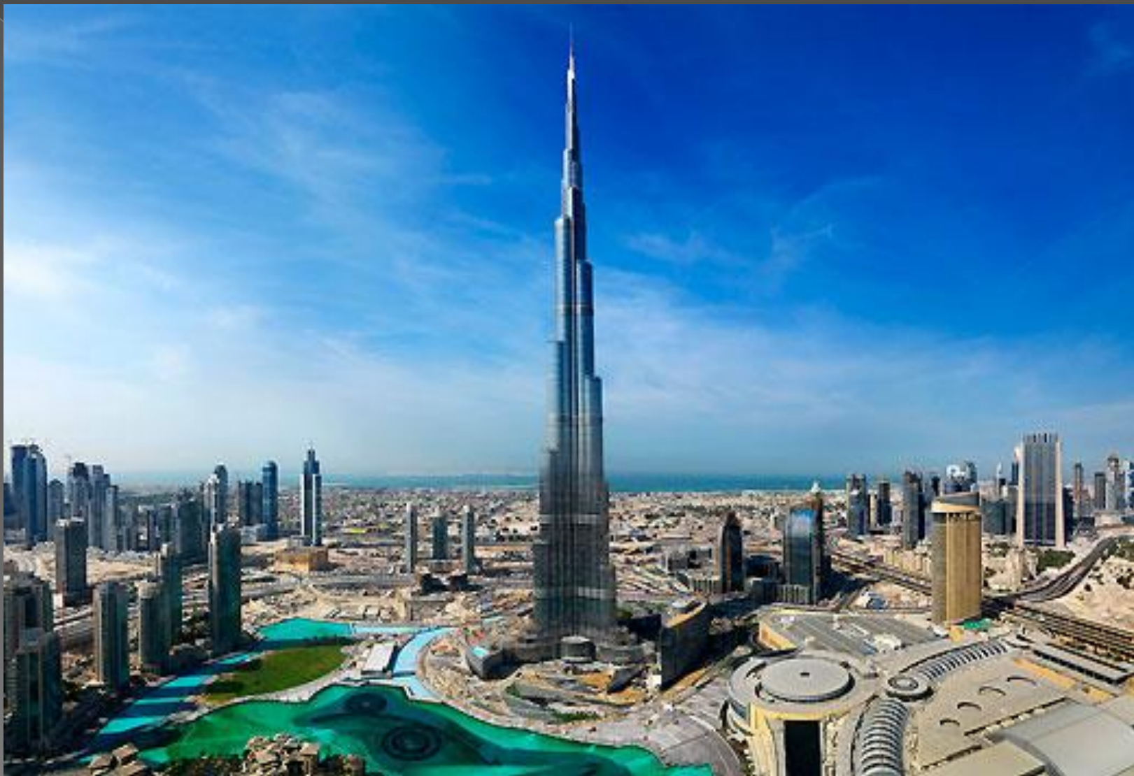
Дубайдағы Бурж Халифа 2016 жыл әлемдегі ең биік ғимарат