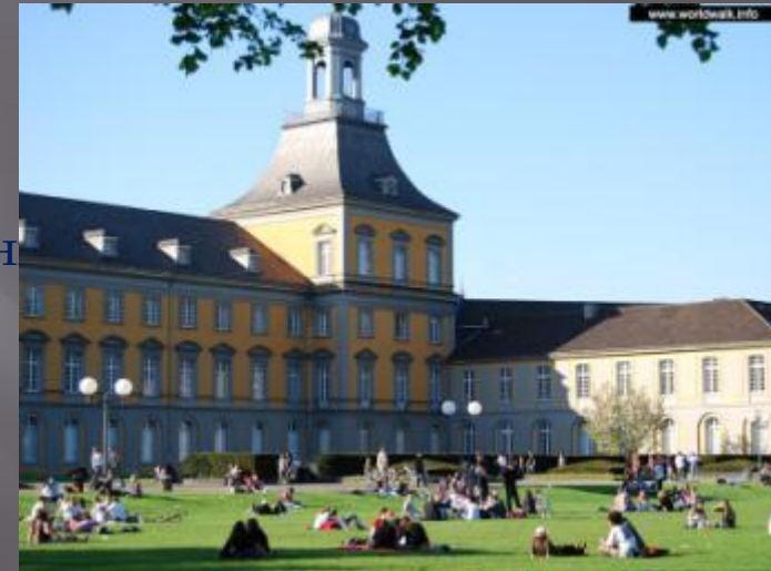
Головна будівля Боннського Університету