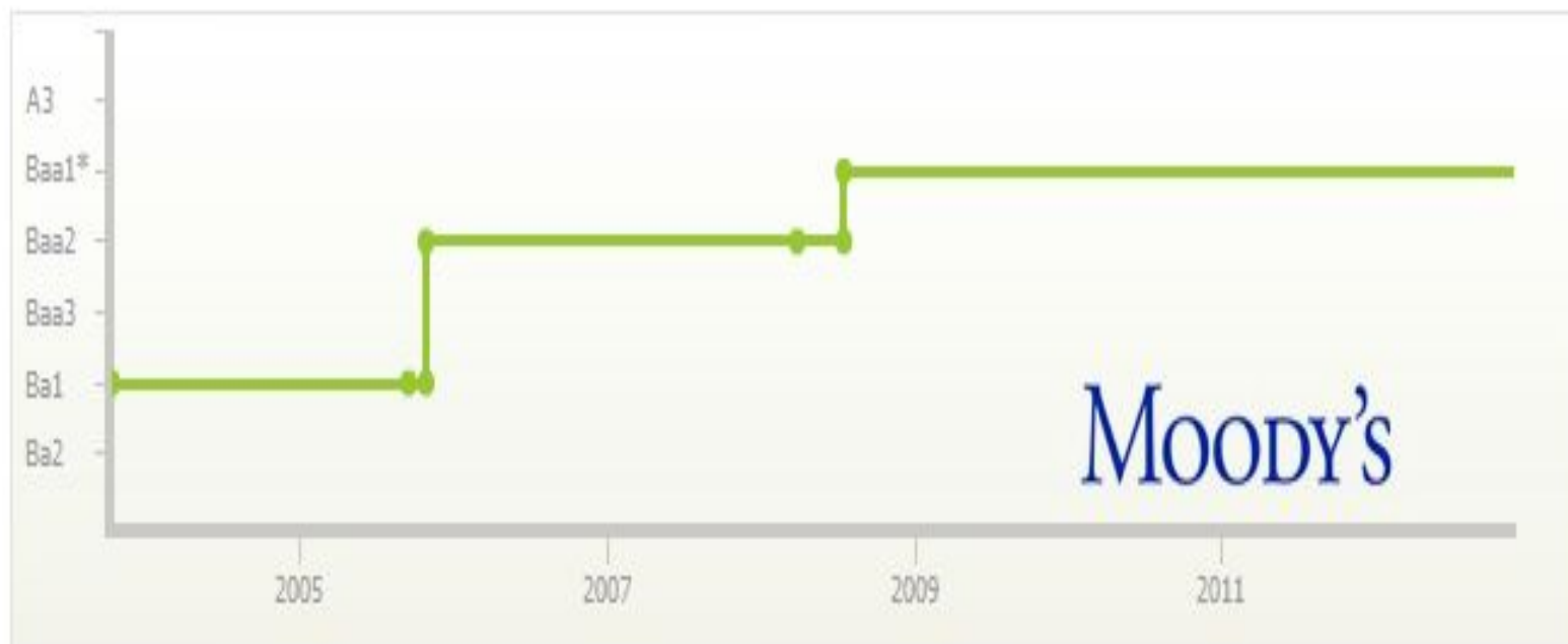
Долгосрчный рейтинг депозитов в иностранной валюте

* Текущий рейтинг, присвоенный Сбербанку России, совпадает с верхней границей долгосрочного рейтинга депозитов в иностранной валюте РФ