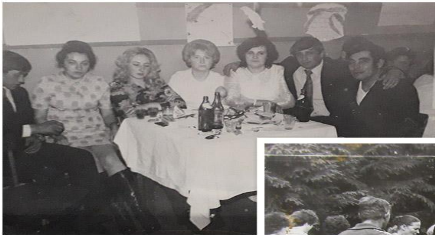
Новогодний огонек в клубе.