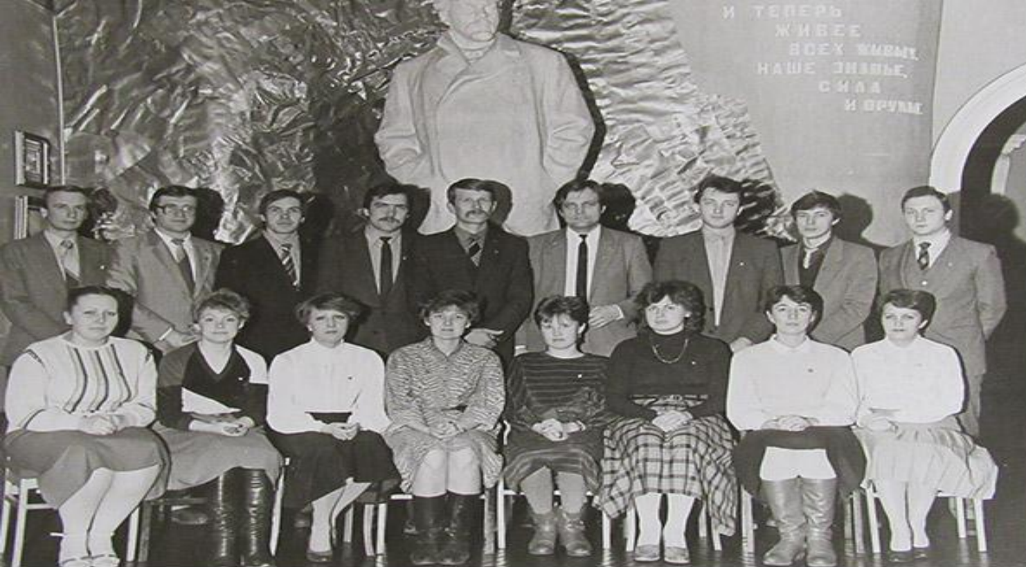
Комсомольский актив Ступинского горкома комсомола 80-х