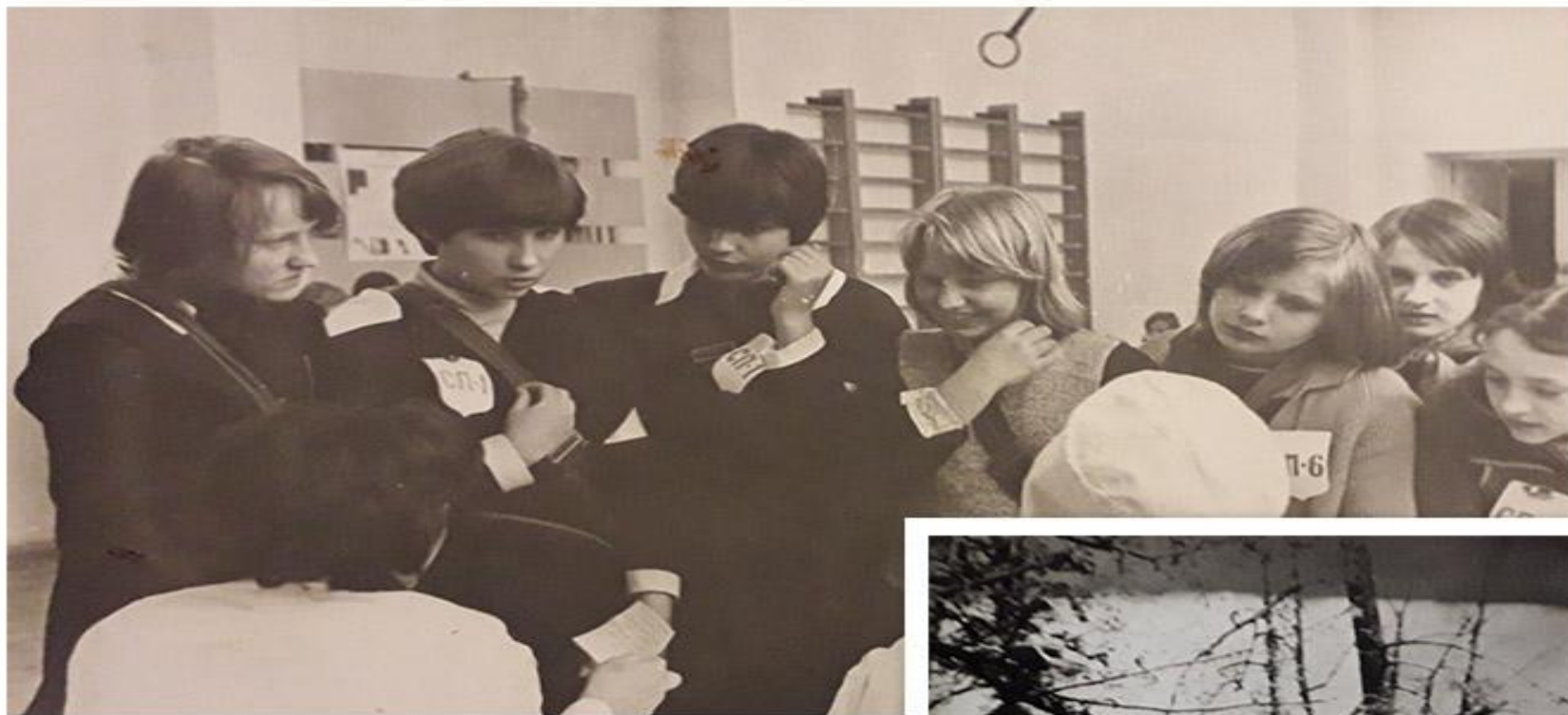
Подготовка санпостов в школе