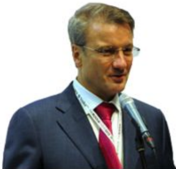
Герман Греф, президент Сбербанка России

«В некоторых отделениях мы проводим эксперимент с бирюзовым подходом. Команда чувствует себя ответственной за построение длительных отношений с клиентами, и это очень сильно повышает вовлеченность и удовлетворенность людей работой. Мы видим самое главное — горящие глаза у клиентов»