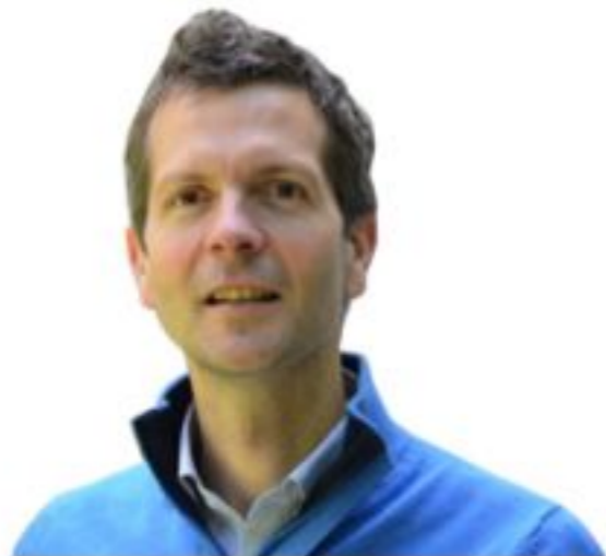
Фредерик Лалу , консультант, партнер McKinsey, обладатель степени MBA

Лалу выделил семь стадий, через которые прошли организации во всем мире. Пять последних существуют до сих пор: красная, янтарная, оранжевая, зеленая и бирюзовая