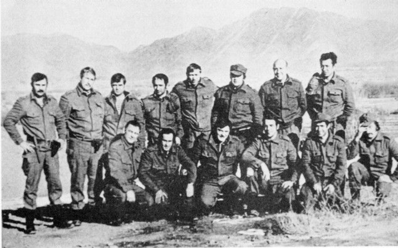
Группа "Альфа" перед штурмом дворца Амина. Афганистан 1979 г.