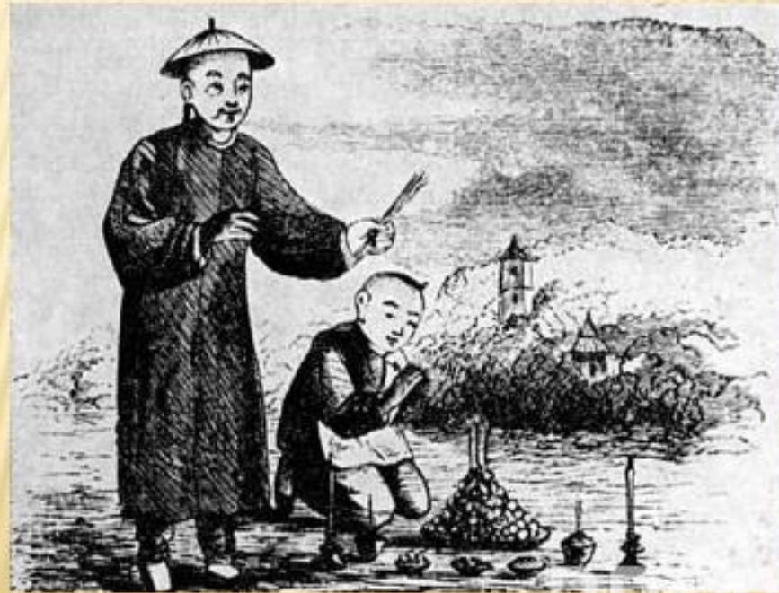
Молодой Конфуций приносит жертву

Исходным пунктом учения Конфуция является достижение гармонии между нравственным совершенствованием человека и его деятельностью. Такая гармония, по его мнению, - залог построения идеального общества и государства. Социальным идеалом послужил золотой век в истории Китая, правление мифических императоров Яо, Шунь и Юй. За прошедшее время общество Китая деградировало, что выразилось в многочисленных конфликтах. Исходя из этого конфуцианство предлагает принцип «выпрямления имен» (возвращение прежнего смысла словам и понятиям), который будет предпосылкой восстановления прежних норм.