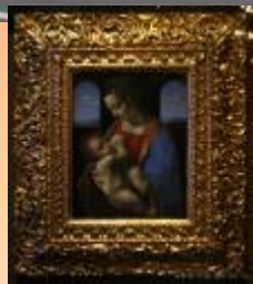
Леонардо да Винчи "Мадонна с Младенцем (Мадонна Литта)"

Эрмитаж в Санкт-Петербурге является одним из самых известных музеев не только в Северной столице, но и во всем мире. Вместе с такими музеями мира как Лувр, Метрополитен и Британский музей он обладает богатой коллекцией и является одним из самых посещаемых музеев мира. В настоящее время коллекция музея насчитывает более 3 000 000 экспонатов. Это в первую очередь картины и скульптуры, предметы прикладного искусства, а также другие произведения искусства. Если рассматривать каждый экспонат по одной минуте, то потребуется 8 лет, чтоб осмотреть всю коллекцию. Для осмотра коллекции Эрмитажа в полном объеме необходимо пройтись по залам Эрмитажа.