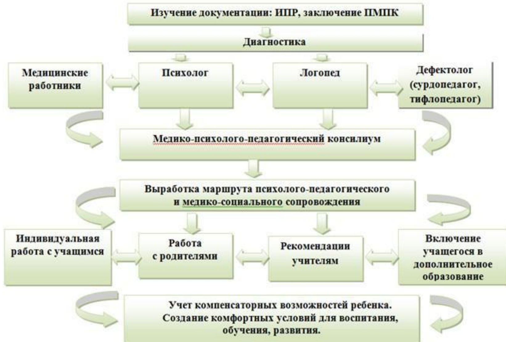
Рисунок 1. Структура комплексного сопровождения обучающегося