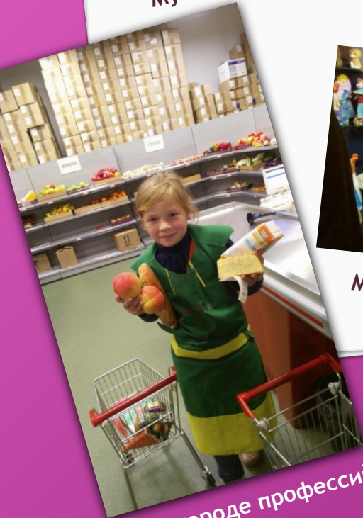
В городе профессий