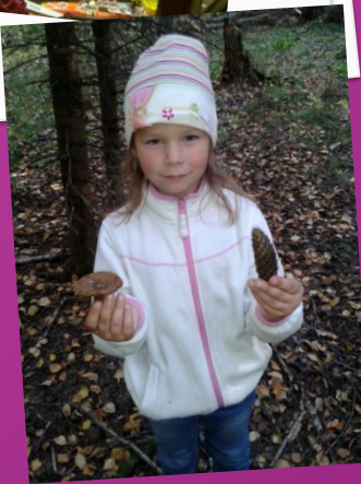
В осеннем лесу

Мой досуг очень разнообразен. В выходные мы с родителями посещаем скалодром, города профессий, батутный центр, кинотеатр и театры, творческие мастер-классы, музеи, парки и другие достопримечательности нашего Москвы и Московской области, выезжаем загород.