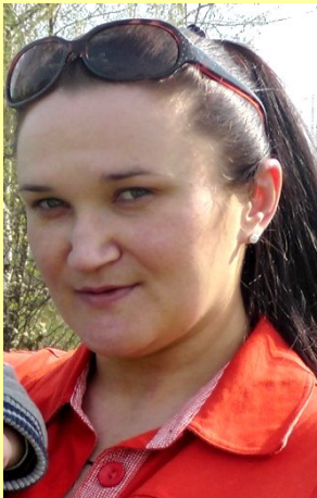
Тетя Оля, папина сестра