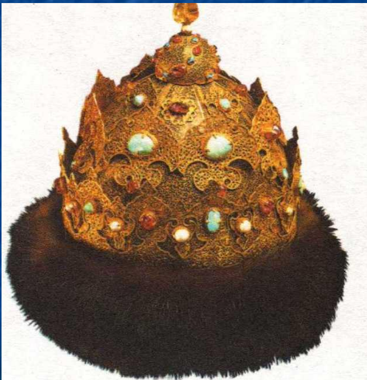
Шапка казанская – корона Ивана Грозного

16 января 1547 г. состоялась торжественная церемония – венчание на царство. Царский титул Ивана IV «Царь и Великий князь всея Руси и Московского государства» был официально подтвержден константинопольским Патриархом.