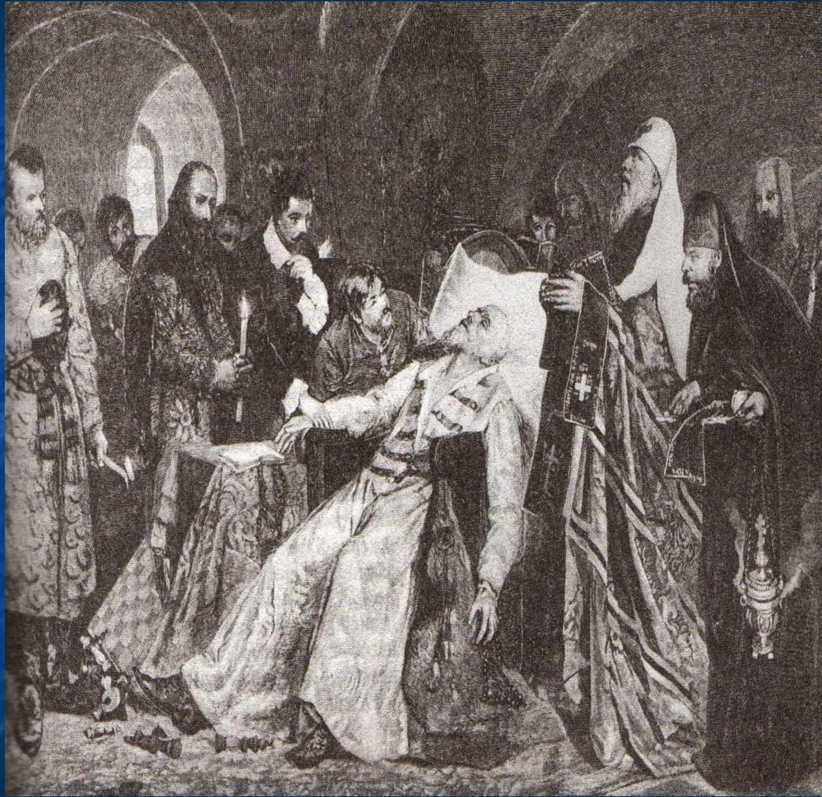
Иллюстрация А. Майман «Смерть Ивана Грозного»