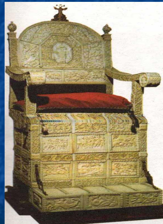
Трон Ивана Грозного