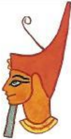
Красная корона правителя Нижнего Египта