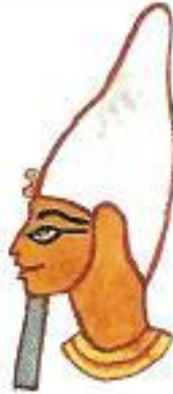
Белая корона правителя Верхнего Египта