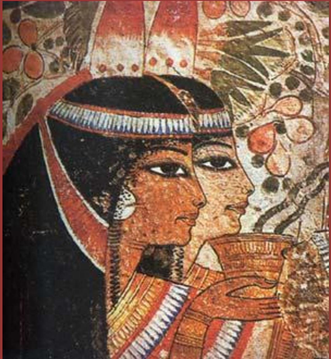
Мать и жена Узерхета. Фрагмент росписи гробницы Узерхета. XIX династия. 2-я половина XIV в. до н. э. ивы, могила Узерхета

Парик с повязками- венцами из мелких металлических пластинок. Керамические сосуды с благовонным маслом. На плечах усхх.