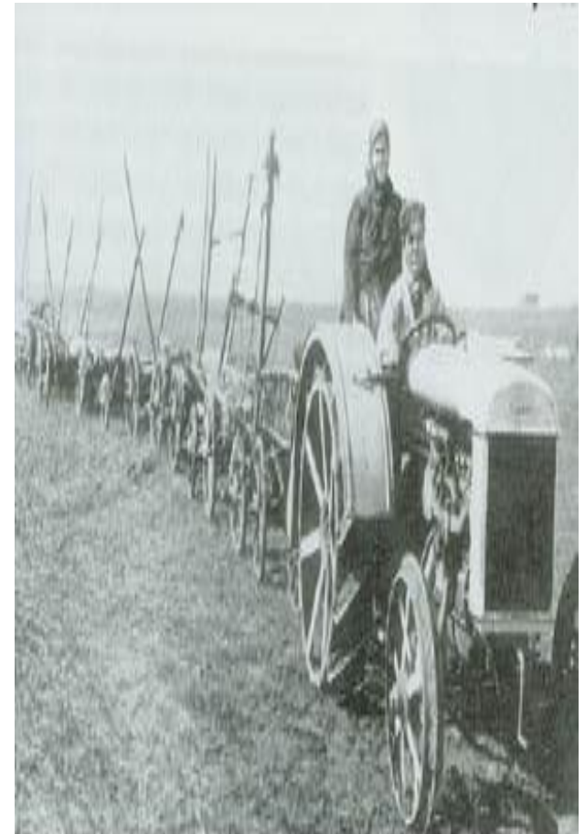
Новая техника на колхозных полях.