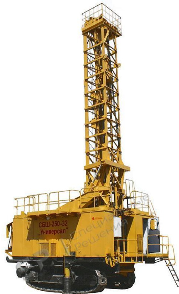
Рисунок 1. СБШ 250 МНА 32

Это самоходный станок, который поставляется в комплектации с электроприводом и базой на гусеничном ходу. Разработан для бурения скважин в породах крепостью 4-20 ед. с высокой образивностью под заряд взрывчатых веществ на открытых горных работах. Скорость передвижения станка составляет от 0 до 1,4 км/ч с возможностью плавной регулировки хода.