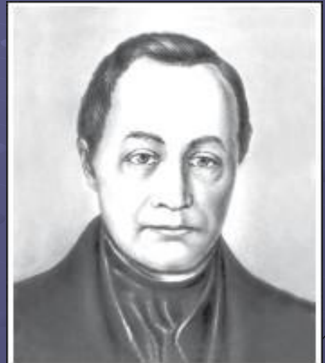
Огюст Конт 1798 – 1857