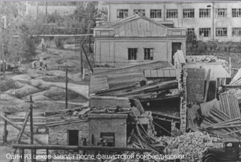
Один из цехов завода после фашистской бомбардировки