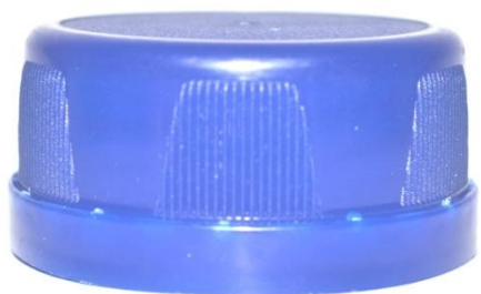
Крышка 45 мм, высокое горло