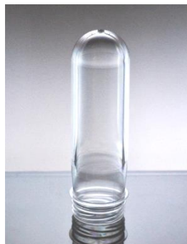
Преформа 65 гр.