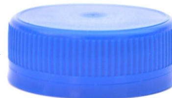
Крышка 38 мм Vericap Вес: 2,85 гр.