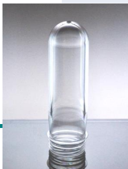
Преформа 65 гр.