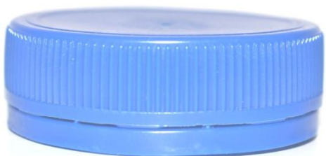
Крышка 48 мм, низкое горло