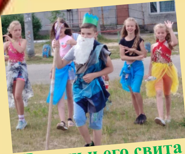
Нептун и его свита