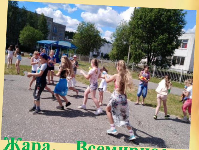
Жара... Всемирное обливание водой...