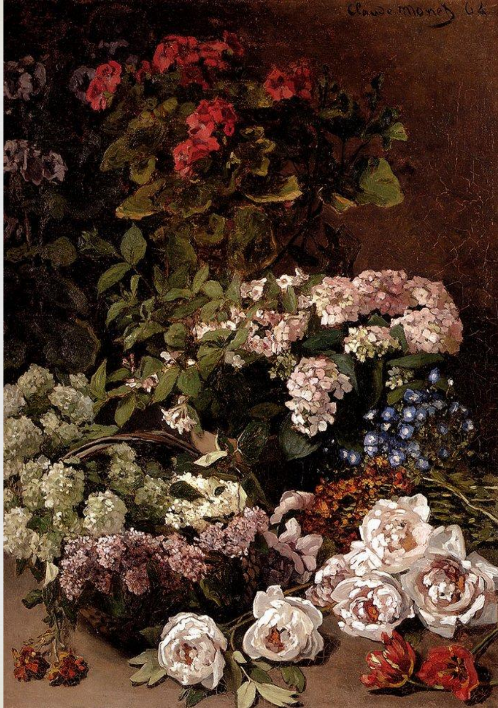
«Весенние цветы». 1864г