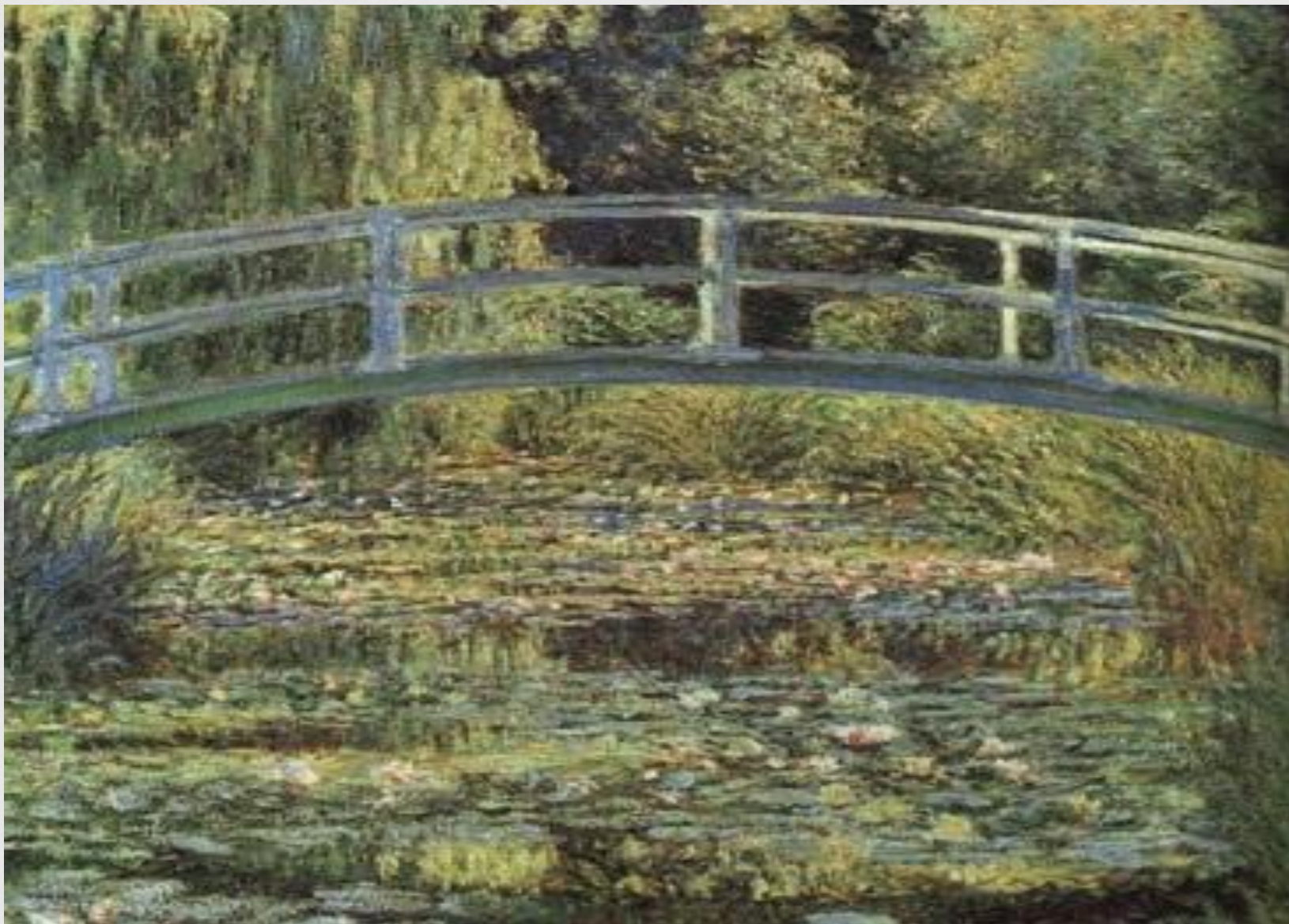
«Пруд с лилиями», 1899 г., Национальная галерея , Лондон