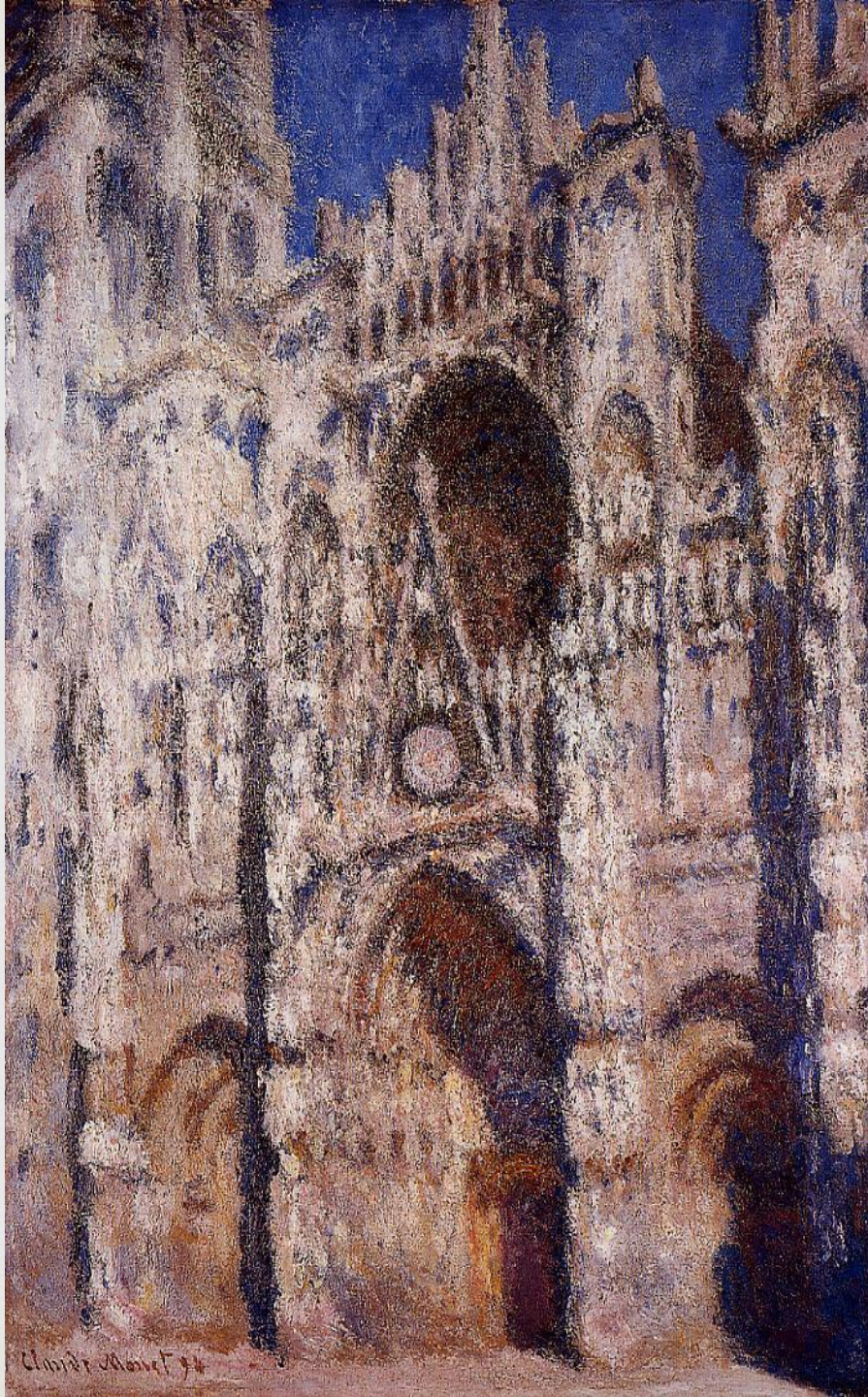
«Руанский собор», 1894г