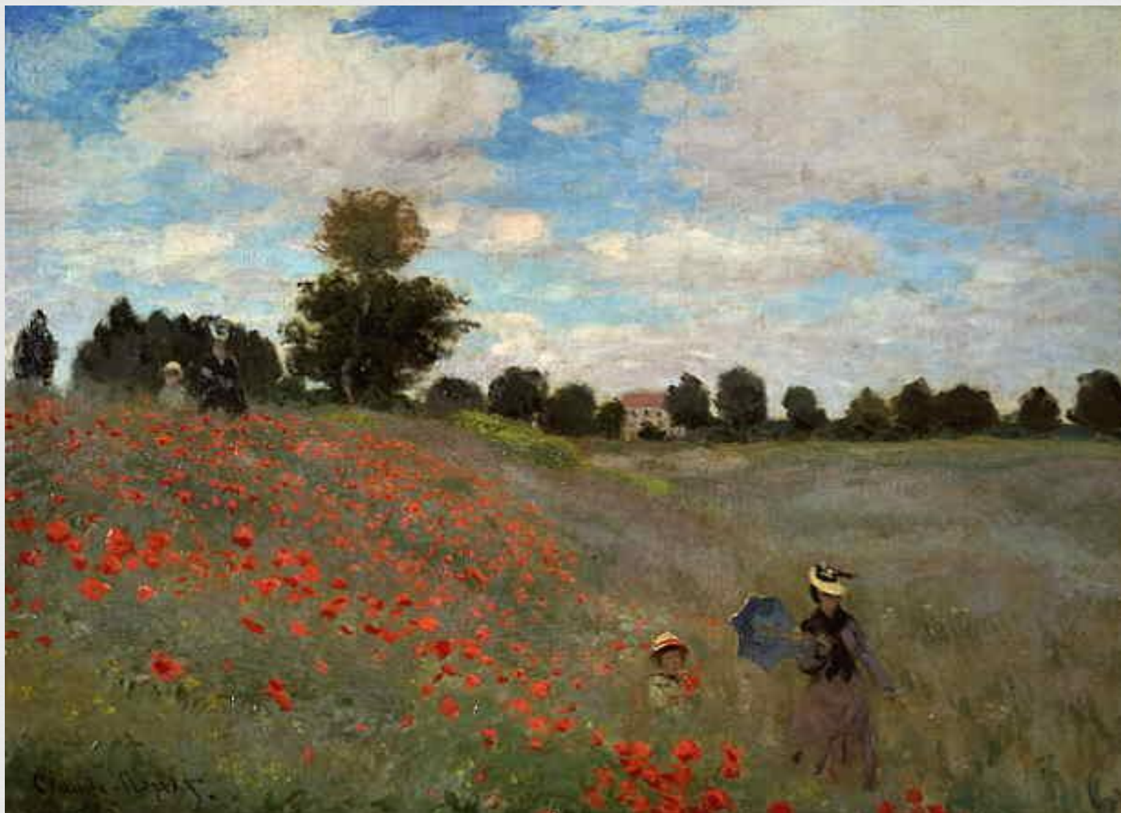
« Поле маков », 1873 г. Музей д'Орсэ, Париж.