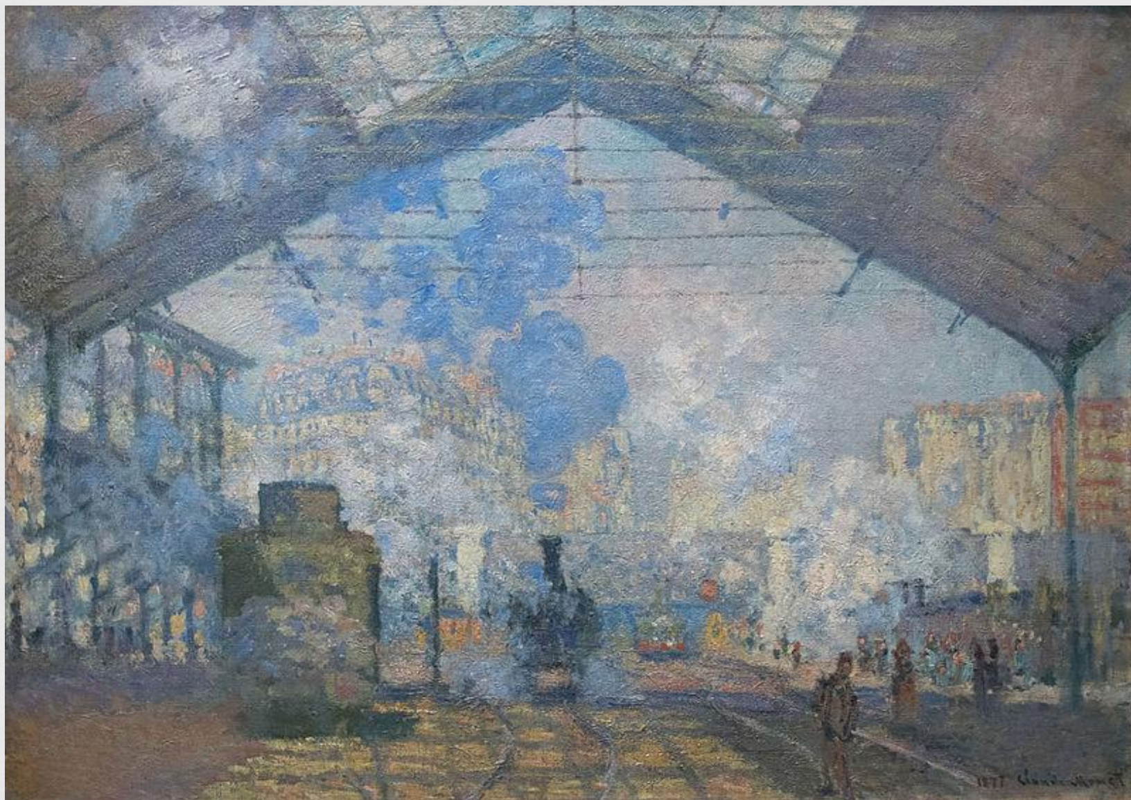
« Вокзал Сен-Лазар », 1877