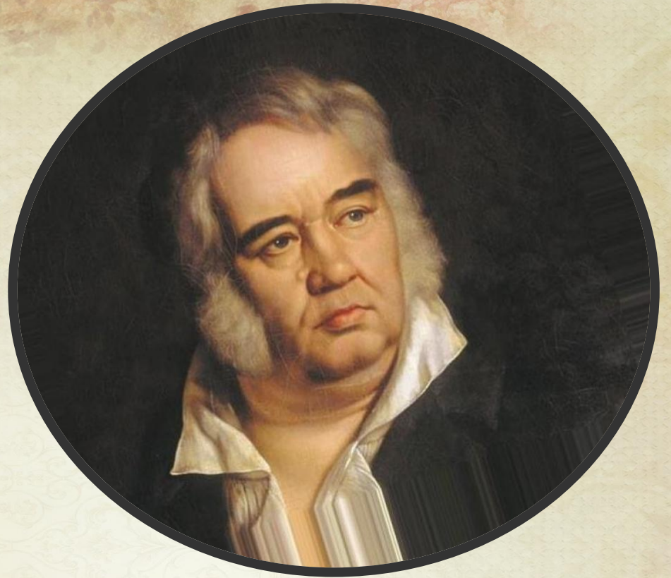
Иван Андреевич Крылов (13.02.1769 – 21.11.1844)