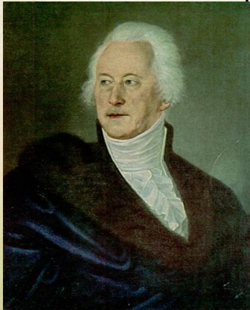
И. А. Дмитревский

Первые литературные неудачи Крылова были связаны с театральной администрацией, его первыми литературными советниками и друзьями были замечательные актеры и одновременно драматурги И. А. Дмитревский. П. А. Плавильщиков.