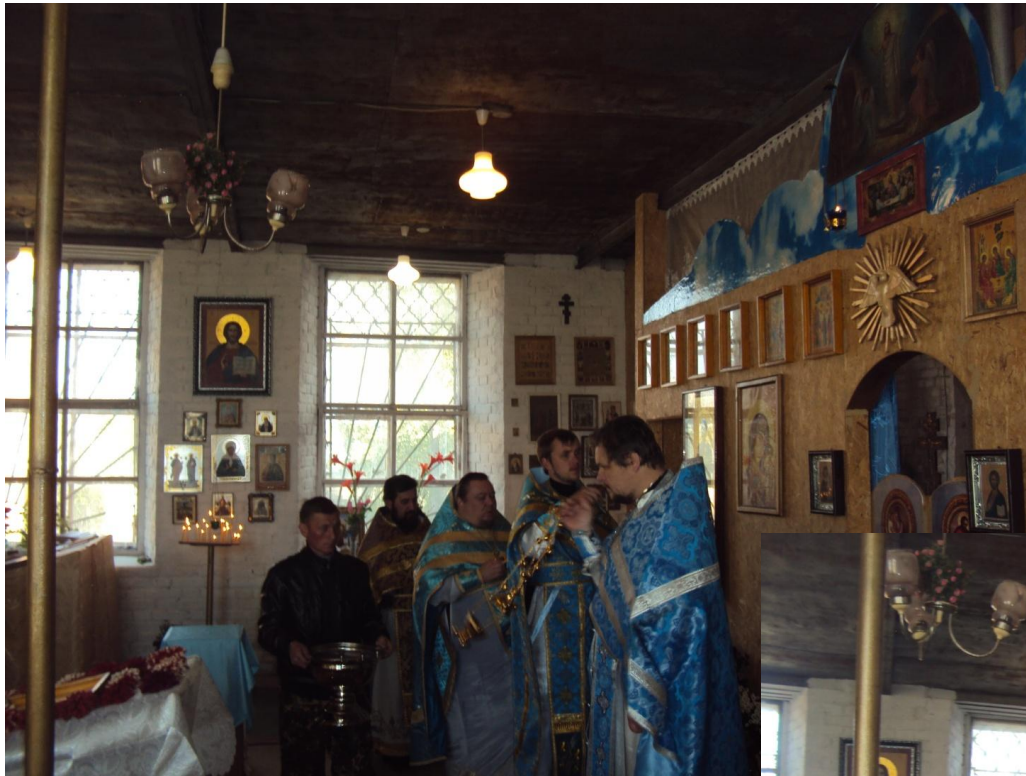
Во время освящения храма 4 октября 2015 года