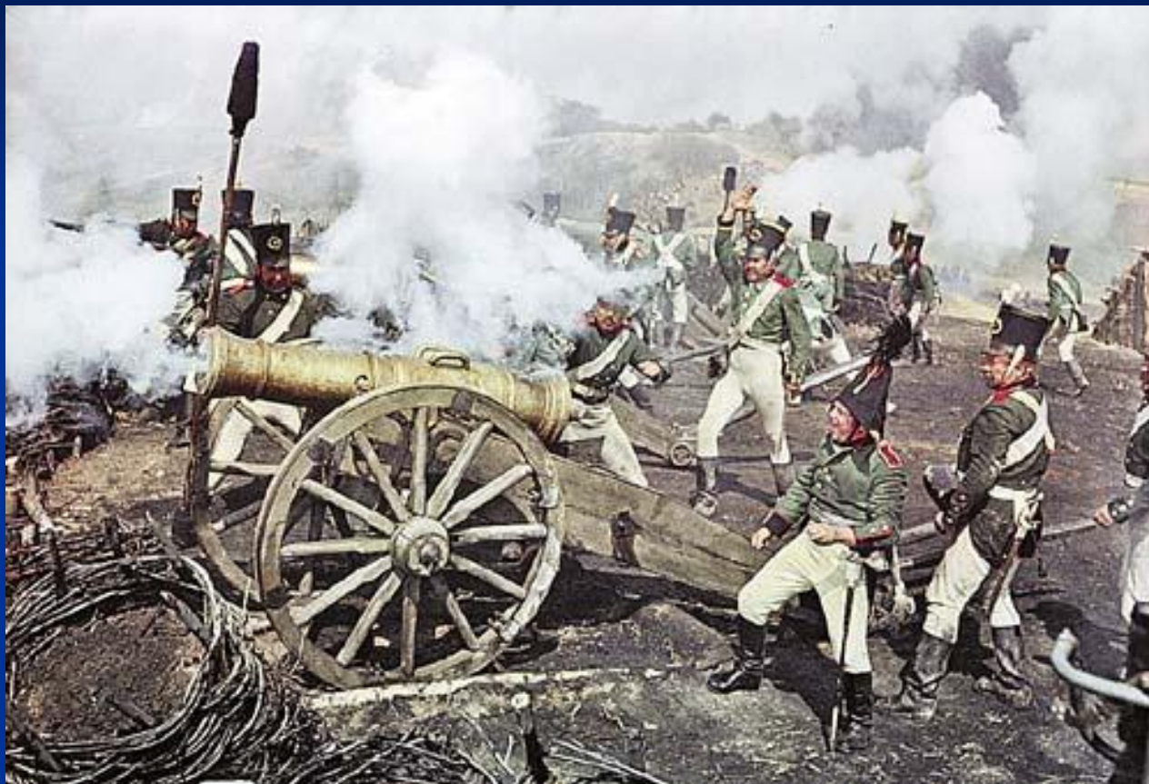
Пьер на батарее Раевского