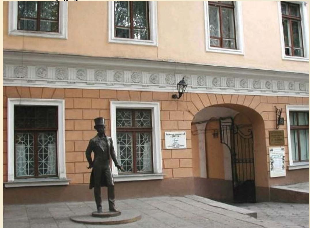
Памятник и музей А.С. Пушкина The Monument to A.S. Pusnkin and A.S. Pushkin Museum