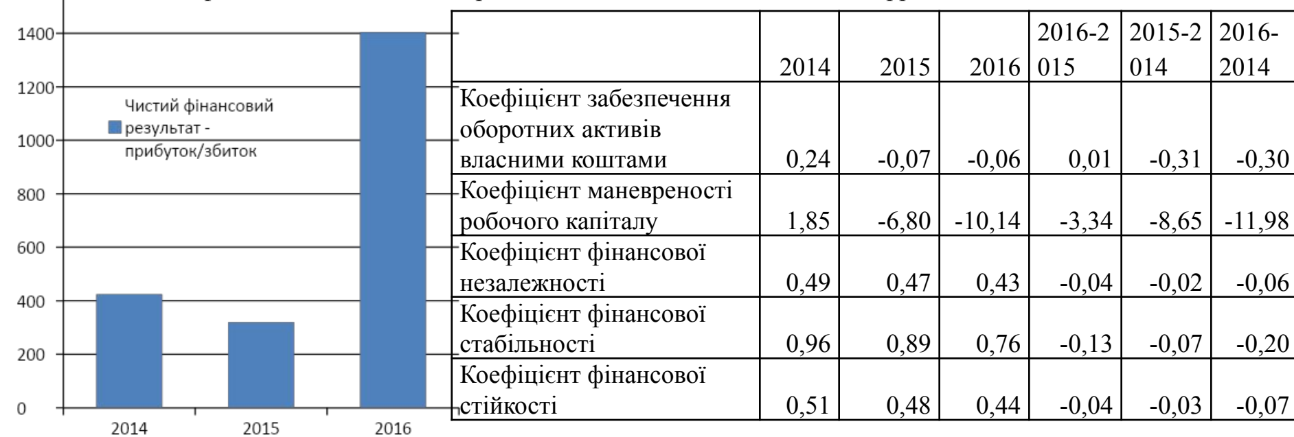
Показники фінансової стійкості підприємства ДП «Лісгосп» за 2014-2016 рр.