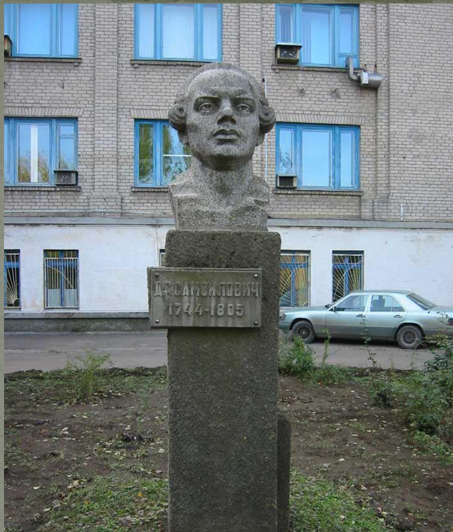
Памятник Даниле Самойловичу, установленный в Николаеве.