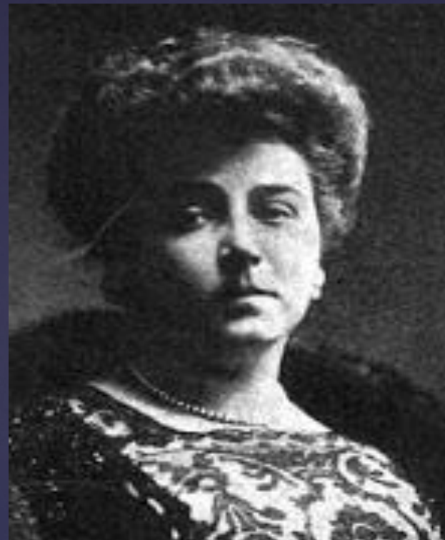
Т. К. Толстая