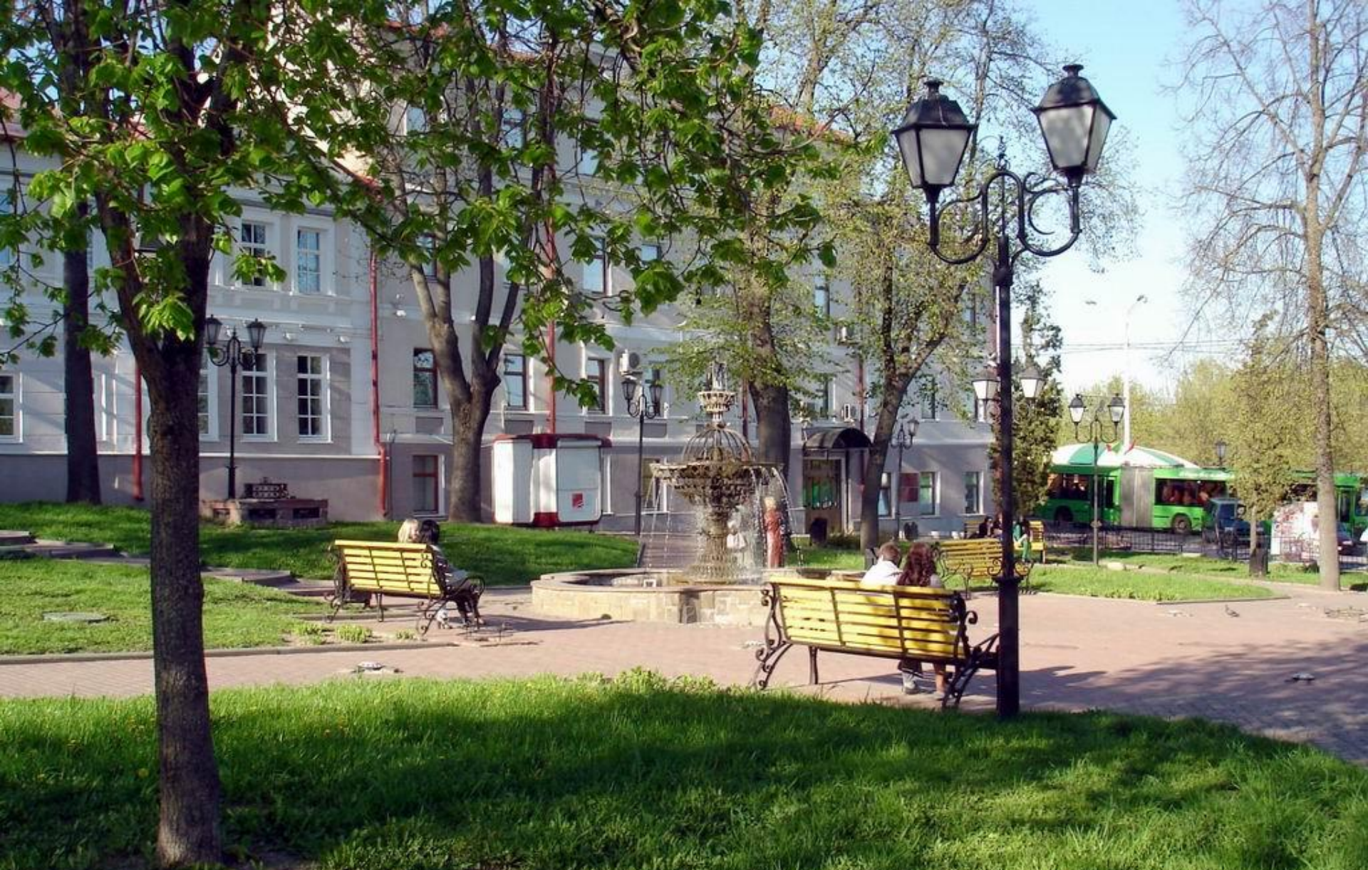
Сквер имени Маяковского