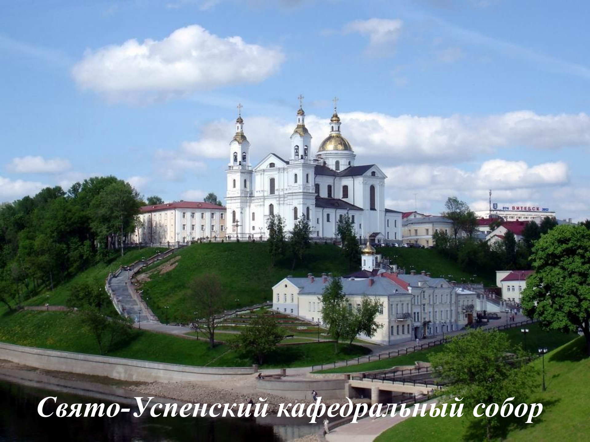
Свято-Успенский кафедральный собор