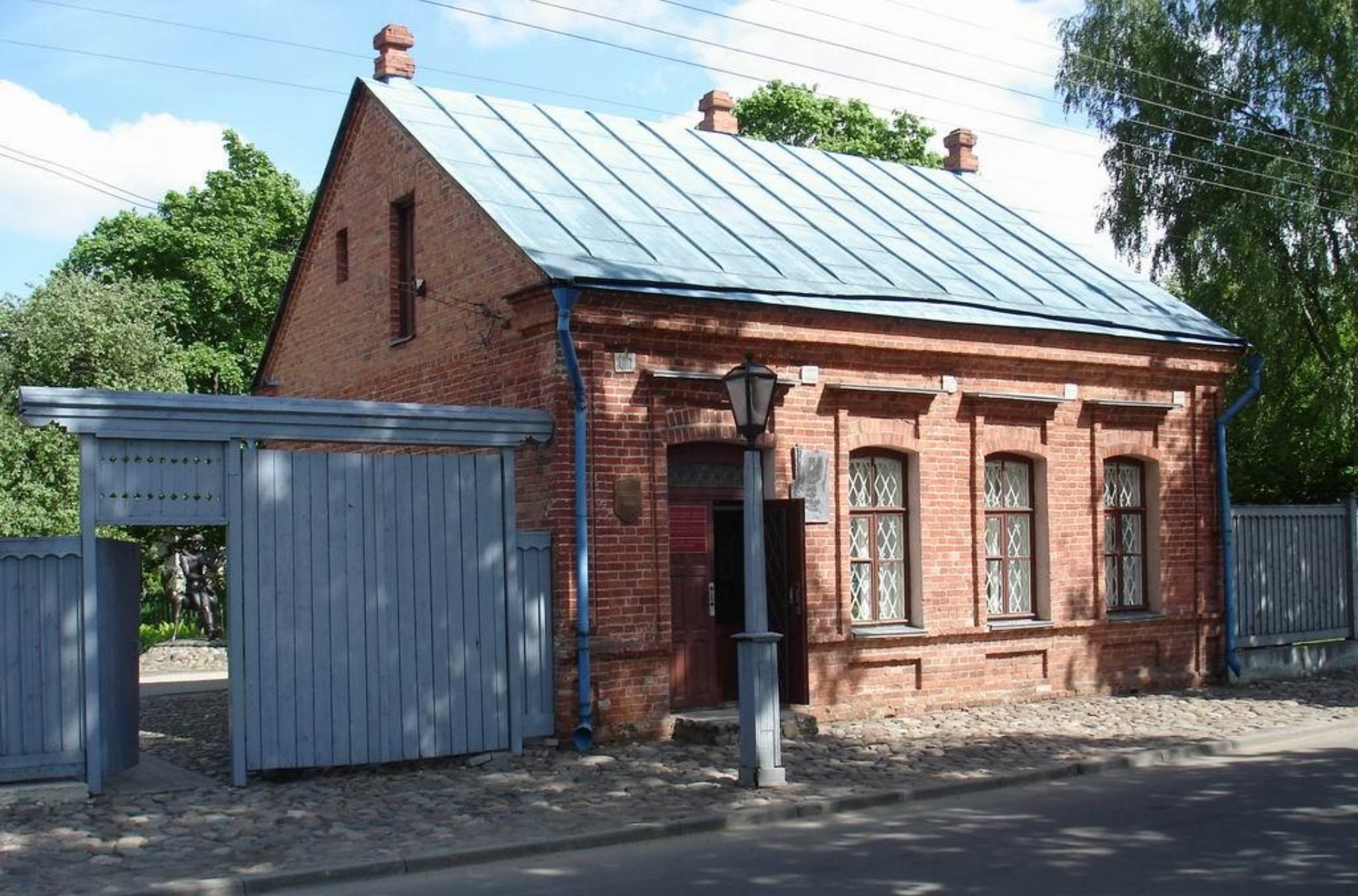
Дом-музей Марка Шагала