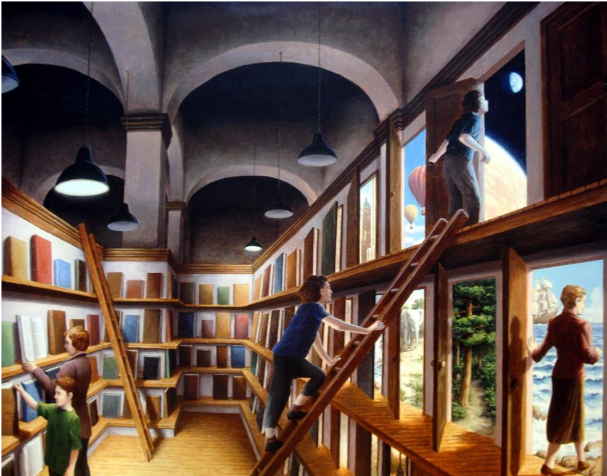
Written Worlds - Rob Gonsalves